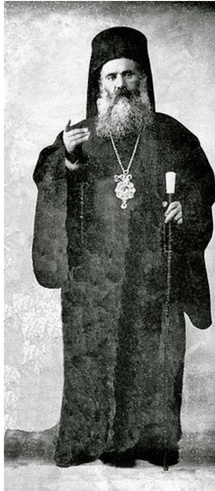
Μητρ. Σμύρνης Χρυσόστομος Καλαφάτης (1867 – 1922)