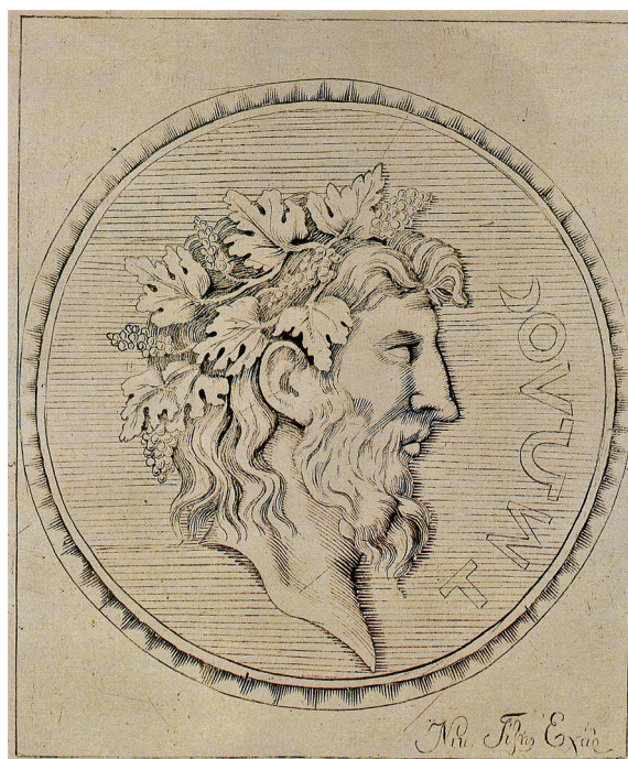
Εικ. 4. Νικόλα Γύζη, Τμώλος , χαλκογραφία, Εθνική Πινακοθήκη και Μουσείο Αλεξάνδρου Σούτζου (Χρήστου 1994).

Το 1887 ο Γύζης πικράθηκε πολύ με την αντιμετώπισή του και από το Πανεπιστήμιο Αθηνών: επί πρυτανείας Γεωργίου Καραμήτσα (1834–1904), η παραγγελία του χρυσοκεντημένου λαβάρου του δόθηκε ταυτόχρονα στον Γύζη 29 και στον νεότερό του Γεώργιο Ιακω-