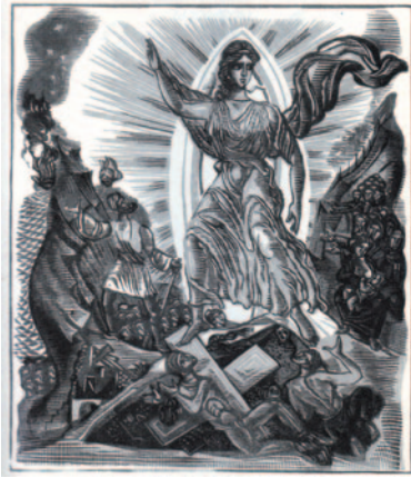
Εικ. 2 Σπύρος Βασιλείου, Η Λευτεριά (Διονύσιου Σολωμού, Ύμνος εις την Ελευθερίαν) , 1947, δίχρωμη ξυλογραφία σε όρθιο ξύλο, 14,9 × 12 εκ.

Ορθά έχει παρατηρηθεί ότι δούλεψε σαν αγιογράφος: σε σκούρο προπλασμό, της μελανωμένης ξύλινης πλάκας, αφαιρεί τα φώτα, τα μέρη που δεν θέλει να τυπώσει! 21 ( εικ. 2 ) Και με άλλην ευκαιρία ο Βασιλείου προσθέτει: