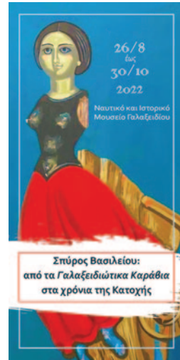
Εικ. 7 Εξώφυλλο του τριπτύχου της έκθεσης.