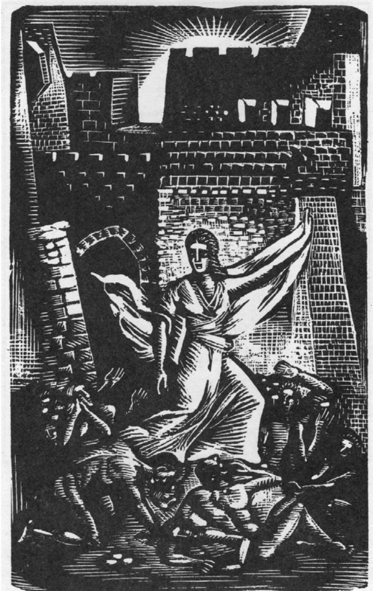
Εικ. 3 Σπύρος Βασιλείου, Μέσ' από τα τείχη , 1943, ξυλογραφία σε όρθιο ξύλο, 12,8 × 7,8 εκ. Από το ομότιτλο βιβλίο του Σωτήρη Σκίπη.