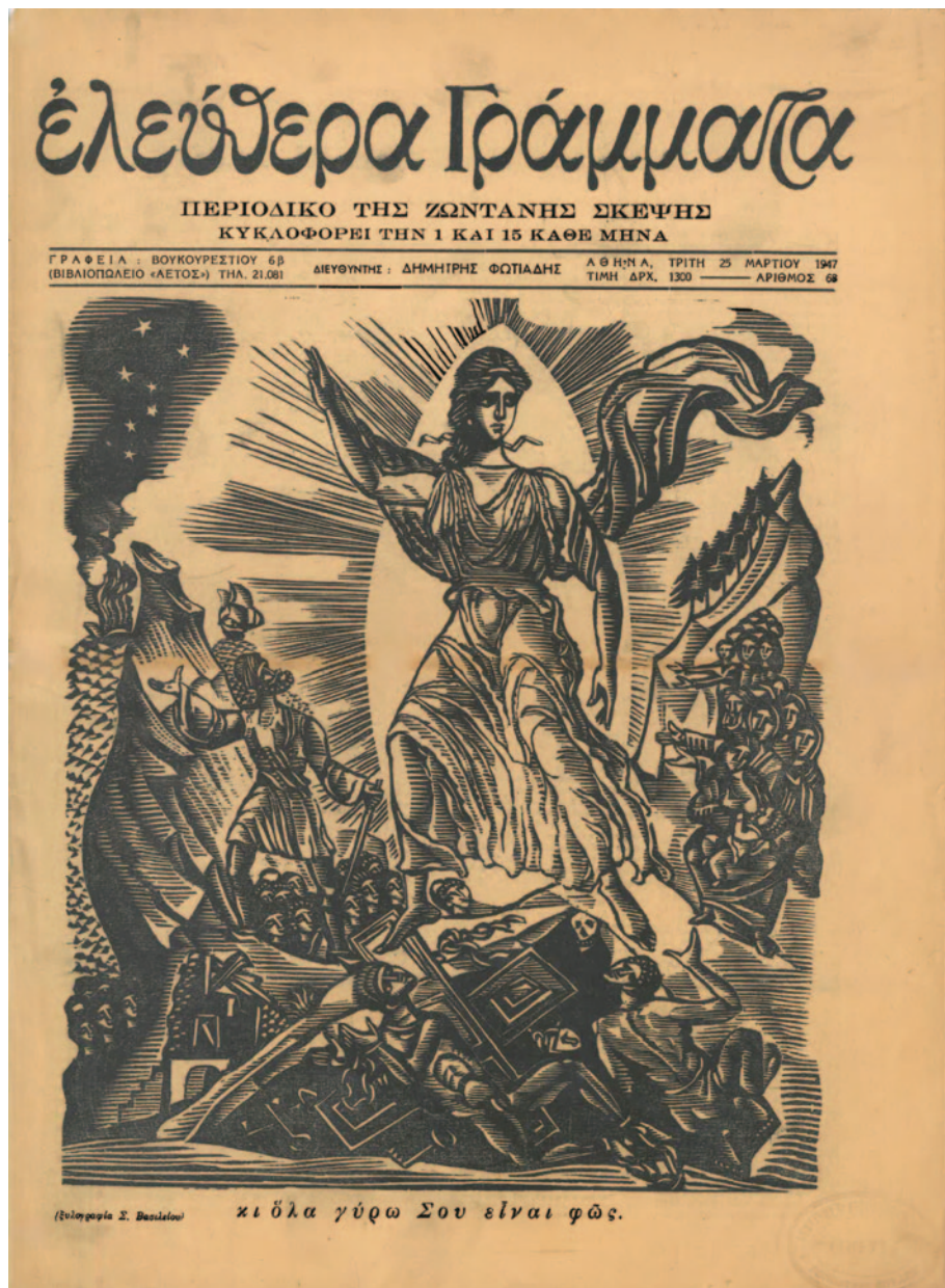
Εικ. 6 Σπύρος Βασιλείου, κι όλα γύρω σου είναι φως (Διονύσιου Σολωμού, Ύμνος εις την Ελευθερίαν), 1947, ξυλογραφία σε όρθιο ξύλο, Συλλογή Βιβλιοθήκης Βελιμέζη.