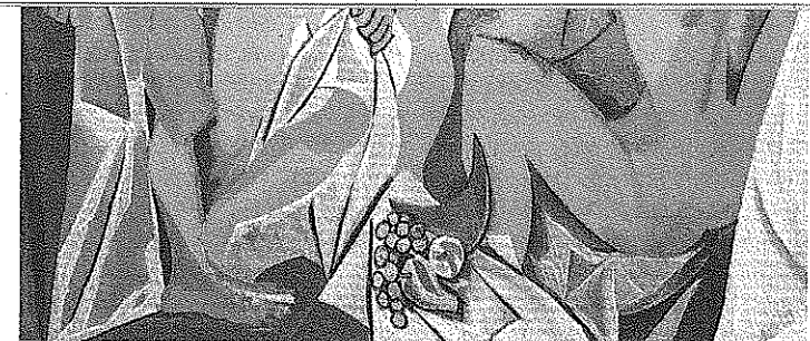
Αριστερά , ο Πικάσο συζητάει με τον γκέπ του γαλλικού κομμουνιστικού κόμματος Μορίς Τορέ, έπειτα από ταξίδι του στη Μόσχα, το 1952. Επάνω, «Οι Δεσποινίδες της Αβινιόν», έργο-αφετηρία του κυβισμού.