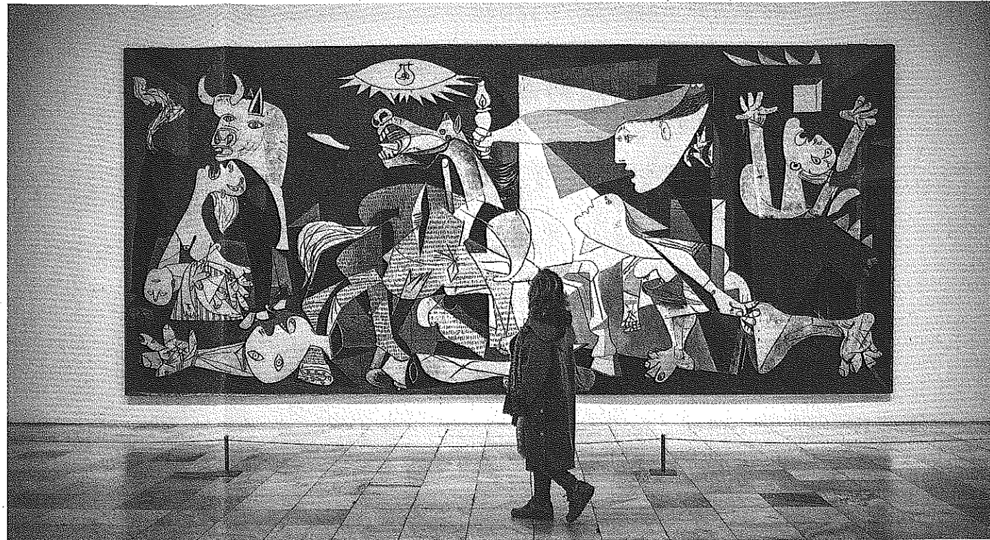
Ο Πάμπλο Πικάσο (αριστερά) καθόρισε με το έργο του τον 20ό αιώνα. Δεξιά η «Γκερνίκα», έργο του 1937, εμπνευσμένο από τον βομβαρδισμό της ομώνυμης βασκικής πόλης από τους Γερμανούς.