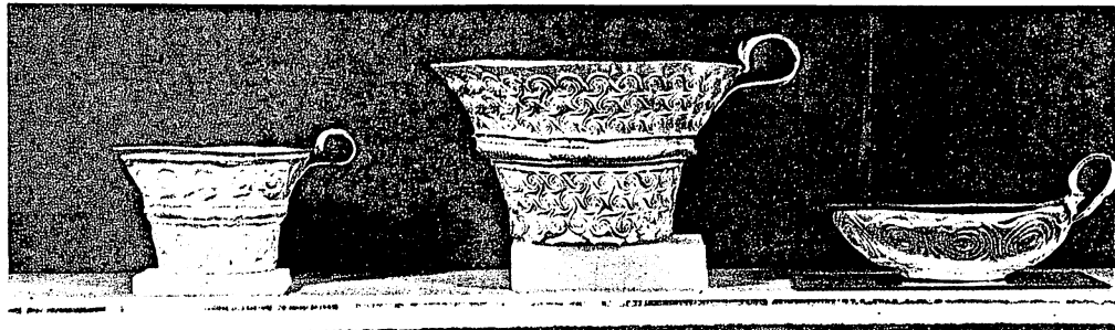
Χρυσὰ κύπελλα ἀπὸ τὸ θολωτὸ τάφο 3 τῆς Περιστεριᾶς (1580 π.Χ.).

'Αλλὰ εὐρήματα ἦταν μικρότατοι χρυσοὶ ἦλοι, μικρὰ διασκάρια με μιά ὀπή, χρυσῆς μέλισσας, χρυσοὶ θύσανοι καί περιδέριαι με μικρὸς ψήφους ἠλέκτρον πράγμα πού ὑποδηλώνει ὅτι τὸ ἐμπόριο τοῦ ἠλέκτρον με τὴν Βόρεια Θάλασσα ἐπεκτείνονταν σὲ ὅλες τὶς σημαντικότερες μυκηναϊκῆς θέσεις τῆς ΝΔ - Δ Πελοποννήσου (Κακόβατος, Ἑγκλιανός, Ρούτση, Τραγάνα, Κουκουνάρα, Βοϊδοκοιλιά). 'Εξάλλου, ἡ μινωικὴ ἐπίδραση θεωρεῖται ὡς δεδομένη καί σάν δείγμα ἀπὸ τὸν τάφο αὐτὸ ἀντιμετωπίζε- ται τὸ ὀλόσμο γυναικεῖο πῆλινο εἰδώλιο τοῦ