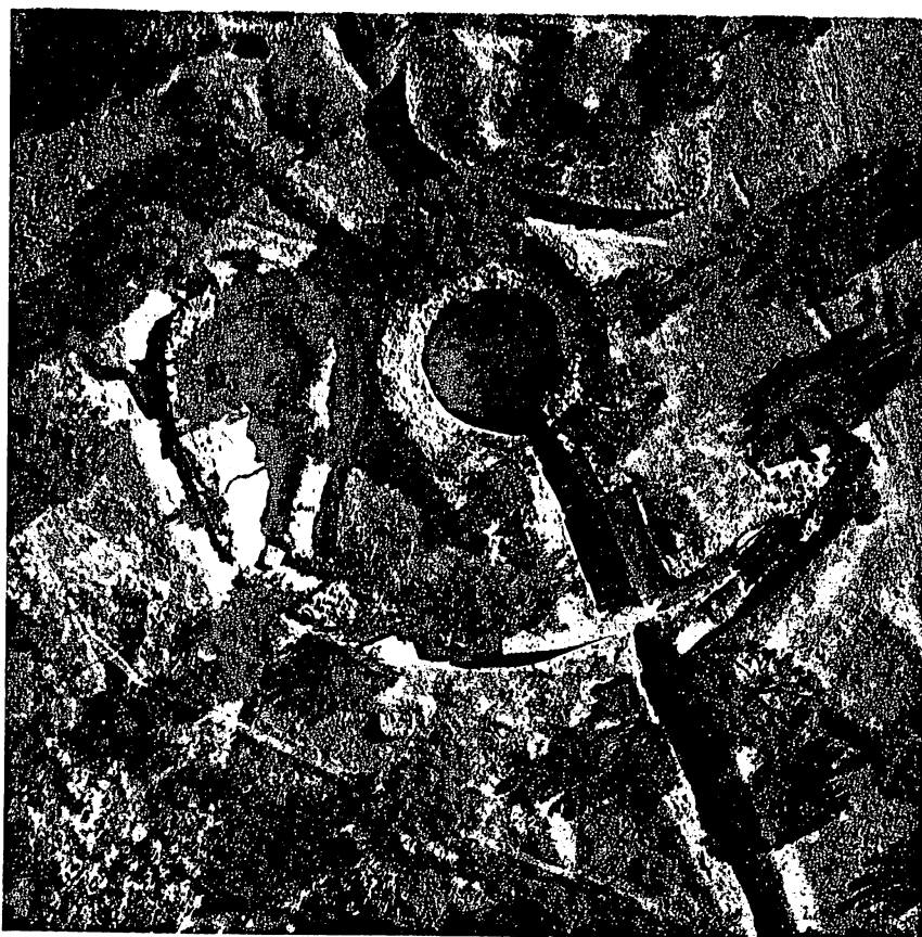
Άριστερά: 'Ο θολωτός τάφος 1 με τόν περιβολο και τήν 'Ανατολική Οίκια (1978). Δεξιά: Στο κέντρο ο θολωτός τάφος 2 «Κύκλος» και άριστερά του ο θολωτός τάφος 3.

προέκυψε και άλλη πρωτομυκηναϊκή οίκια στο ΒΔ τμήμα του λόφου με χονδροειδή και με άδριατική κεραμική και με πλήηνα όμοιώματα μεταλλικών άγγείων.