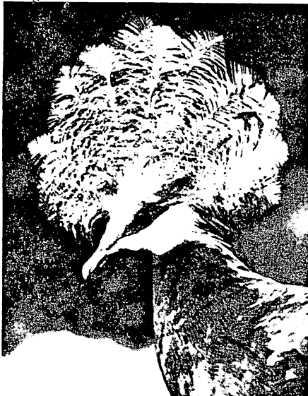
Περιστέρι με στέμμα.

τα. Έτσι, ο τάφος με δρόμο προς την κατωφέρεια του λόφου και τύμβο μέχρι το ύψος του άνωφλίου, είχε θόλο ελεύθερη να υψώνεται προς τον ουρανό και στρώμα πηλού που την προστάτευε μέχρι και το τέλος των Έλληνιστικών χρόνων.