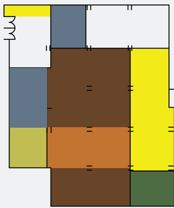
2 ος όροφος Φιλοσοφικής Σχολής