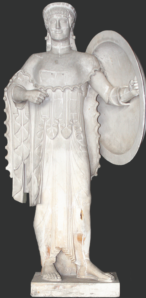
Το φυλλάδιο τυπώθηκε με την ευγενική χορηγία του Ιδρύματος «Α.Γ. Λεβέντης»

Ώρες λειτουργίας: Δευτέρα έως Παρασκευή 8.30' - 16.30'