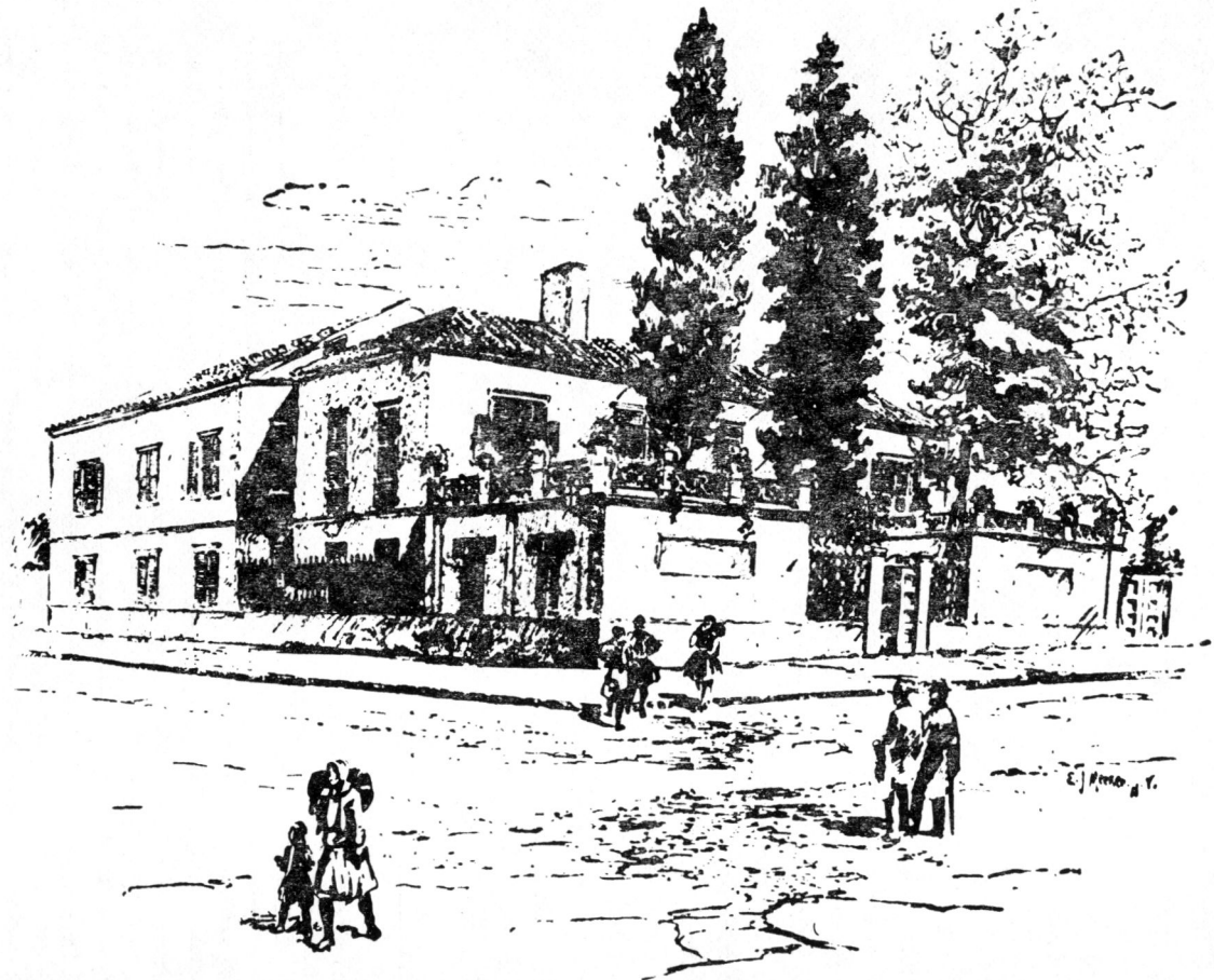
4. Τὸ κτίριο τῆς Σχολῆς Χίλλ, στὴ συμβολὴ τῶν ὁδῶν Θεουκιδίδου καὶ Νικοδήμου. Σκίτσο χρονολογημένο περίπου λίγο μετὰ τὰ μέσα τοῦ αἰῶνα