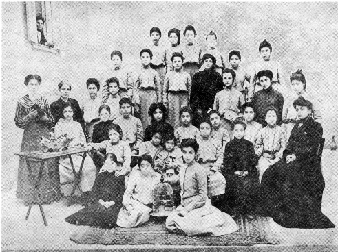
1. «Έτος 1903-1904. Τὴν ἔκθεσιν τὴν σχολικὴν, 1η ἡμέρα τῶν Τριῶν Ἱεραρχῶν»