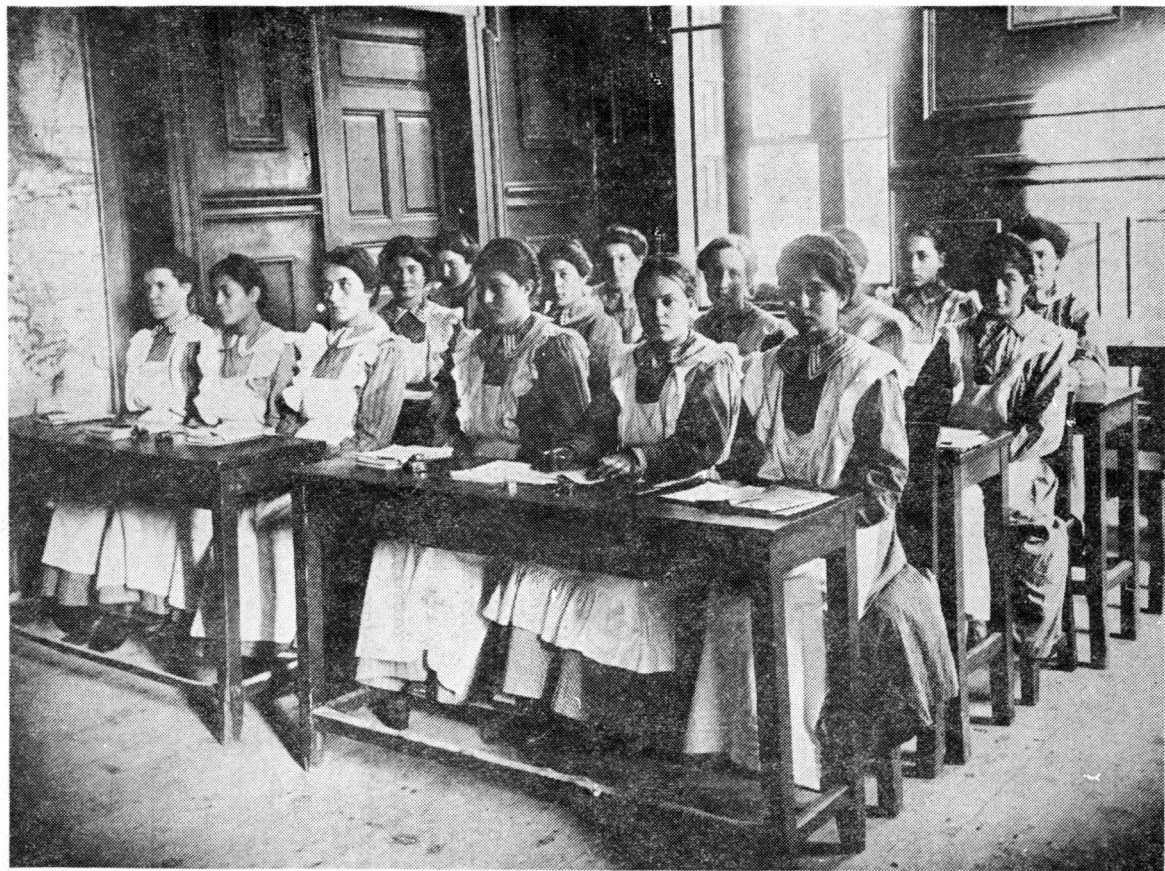
10. [Οίκοκυρική] Σχολή τῆς Ἐνώσεως τῶν Ἑλληνίδων