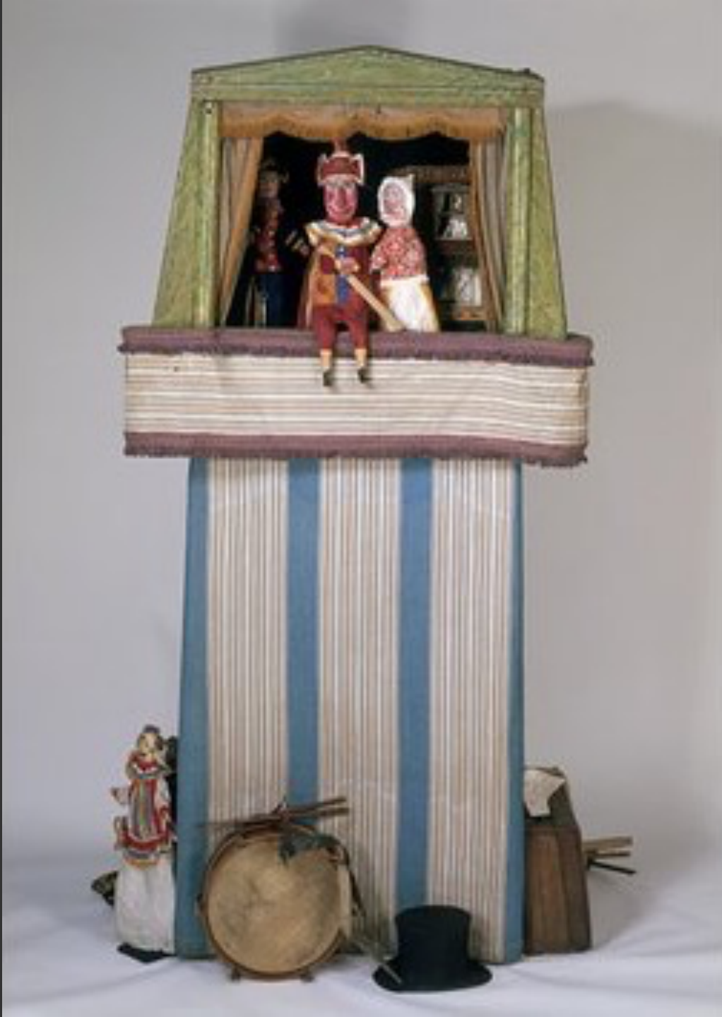
Punch and Judy