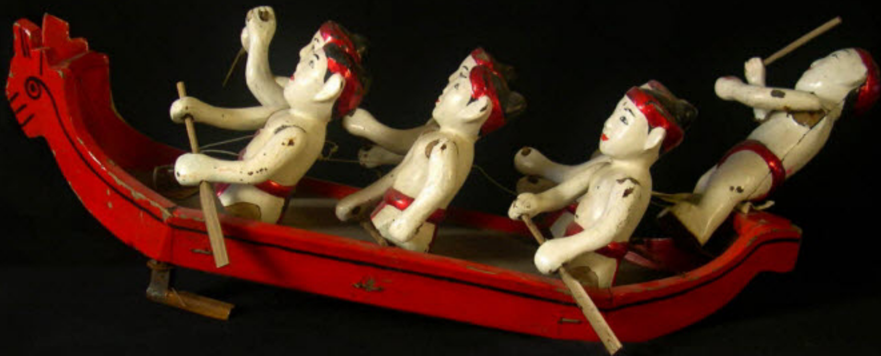
Βιετνάμ Μαριονέτες στο νερό