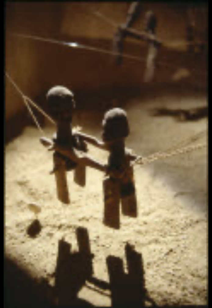
Μαριονέτες της Αφρικής