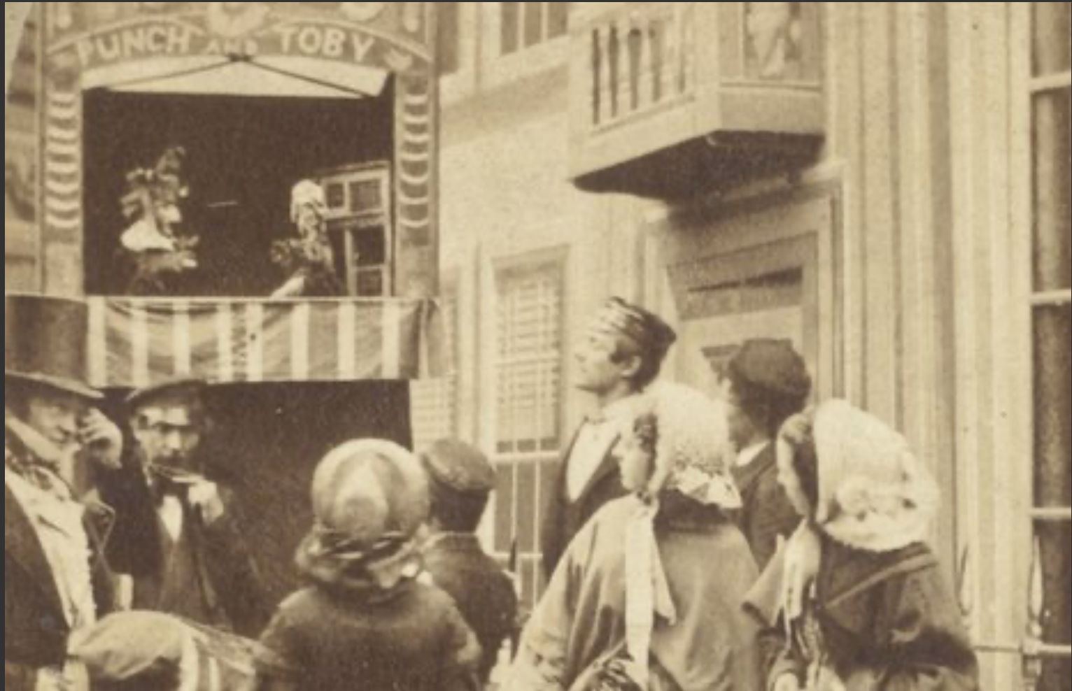
Detail from first photograph showing a "Punch and Toby" puppet show dated 1860s. (From George Speaight Punch & Judy Collection)

http://www.bbc.com/news/entertainment-arts-17895716