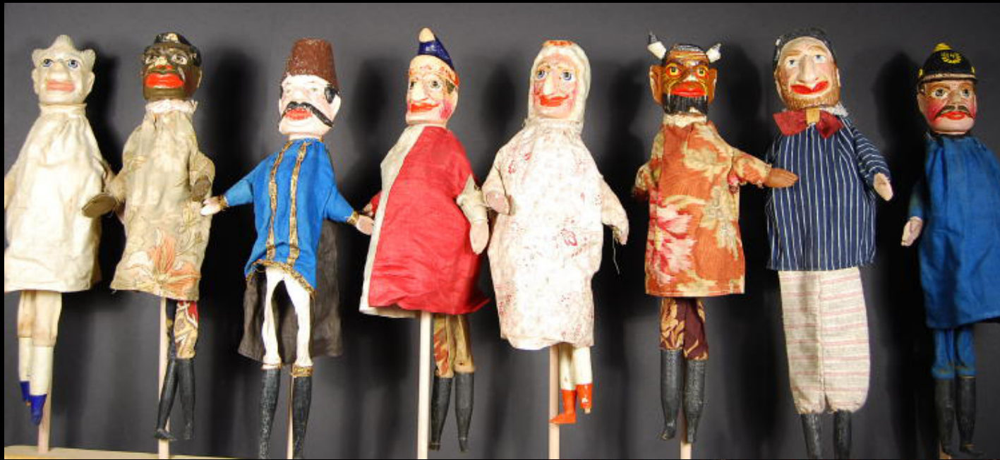
Punch, Judy, the Ghost, the Devil, Jack Ketch,

Σκαλιστό ξύλο σεντ 8, Γερμανία. 18 "ύψος. Χρονολογούνται γύρω στο 1890