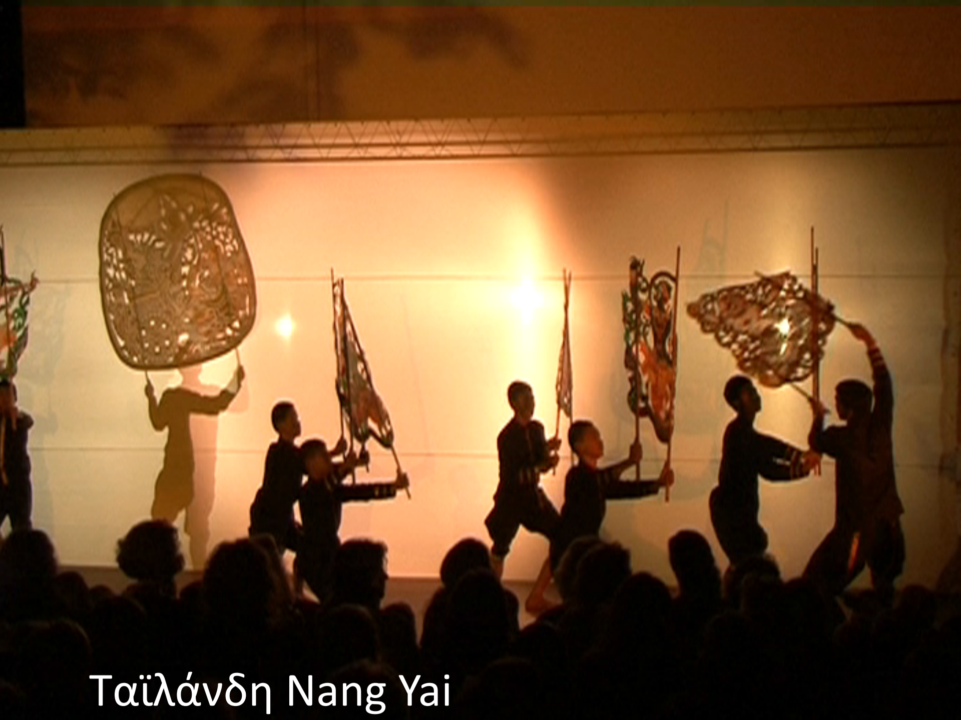
Ταϊλάνδη Nang Yai