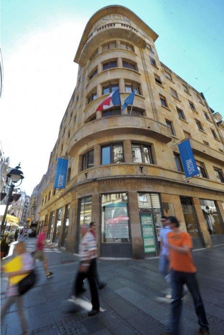
Institut français de Belgrade