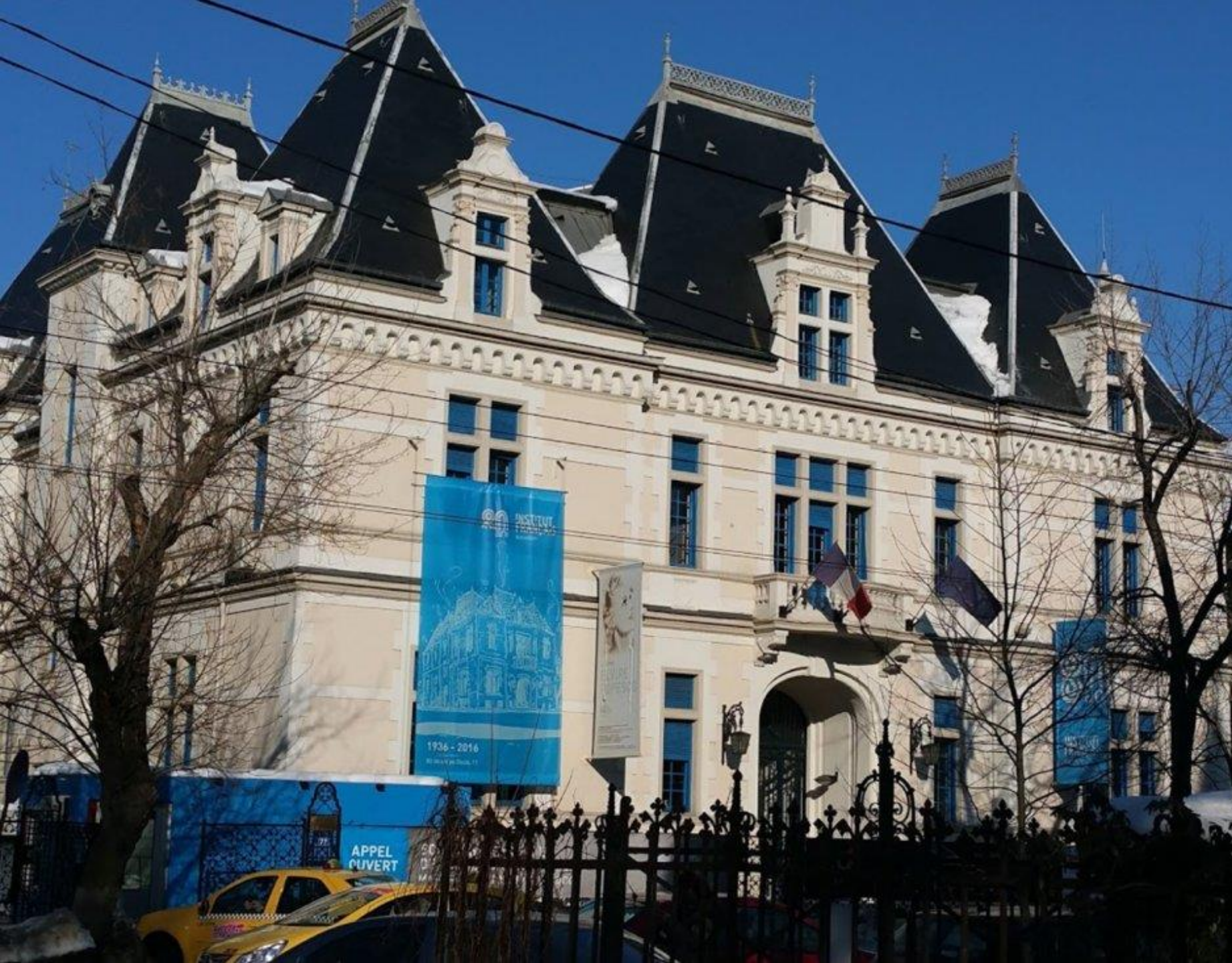
Institut français de Bucarest