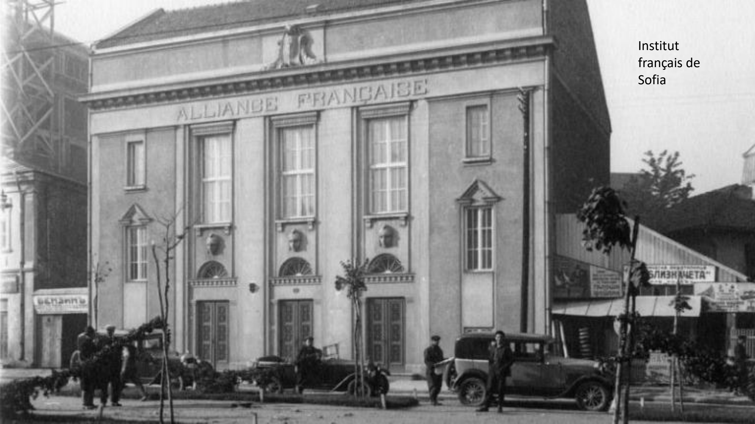
Institut français de Sofia