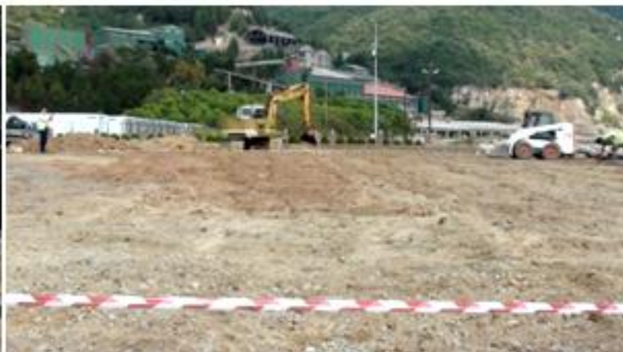
Χειροδιαλογή και απομάκρυνση ογκολίθων- ομογενοποίηση .