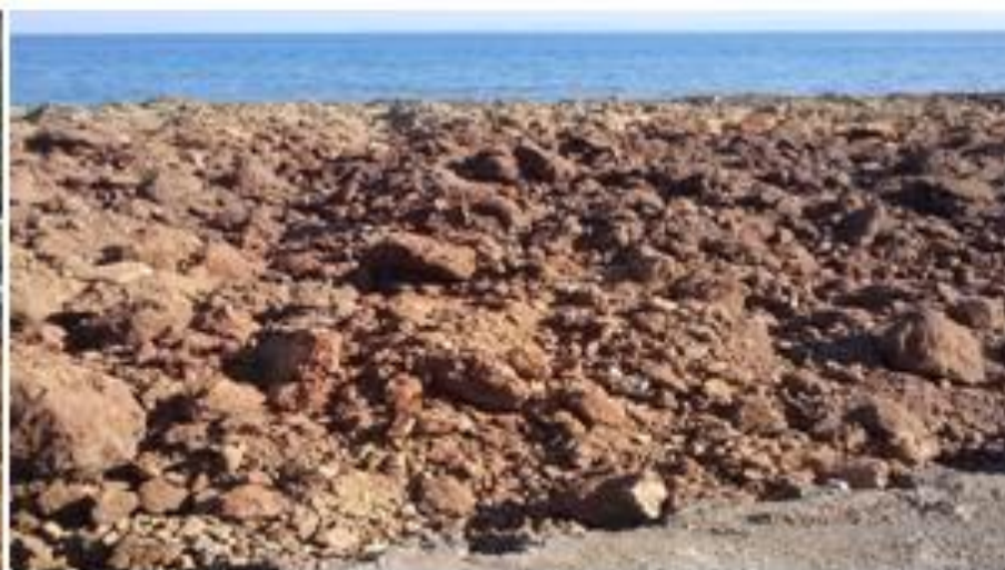
Προετοιμασία πεδίου- εκσκαφή.