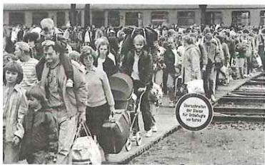
Flucht von DDR-Bürgern in den Westen

1969 wird die SPD zum ersten Mal führende Regierungspartei. Willy Brandt (Bundeskanzler 1969–1974) beginnt eine Ostpolitik, durch die auch die Bundesrepublik Deutschland und die DDR wieder miteinander sprechen. Auch mit anderen Staaten des Warschauer Paktes, u. a. Polen, gibt es Gespräche. Berühmt geworden ist der Kniefall von Willy Brandt vor dem Denkmal im Warschauer Ghetto. Damit bat er die Polen bzw. die polnischen Juden im Namen aller Deutschen um Vergebung für die Verbrechen der Nationalsozialisten. Die DDR und die Bundesrepublik Deutschland unterschreiben einen Vertrag und nehmen diplomatische Beziehungen auf. 1974 wird Helmut Schmidt (SPD) Nachfolger von Willy Brandt. Die Studentenbewegung beeinflusst die weitere Entwicklung stark: Die Frauenbewegung und die Diskussionen um Gleichberechtigung werden stärker, die Umweltbewegung protestiert gegen Atomkraftwerke. 1980 entsteht die Partei Die Grünen. Außerdem erlebt die Bundesrepublik in den siebziger Jahren eine Reihe Anschläge durch linke Terroristen. Höhepunkt ist das Jahr 1977.