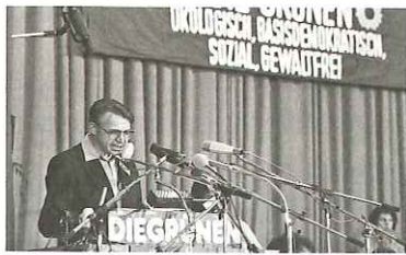
Gründungsparteitag der Grünen