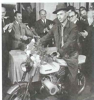
Der einmillionste so genannte Gastarbeiter

Die Deutsche Demokratische Republik (DDR) entsteht am 7. 10. 1949 als sozialistischer Staat, der sich an der Sowjetunion