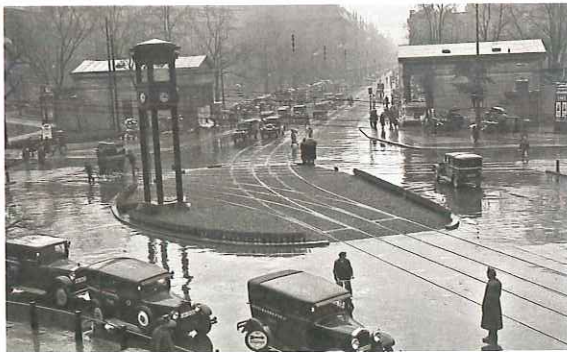
Der Potsdamer Platz in Berlin im Jahr 1930