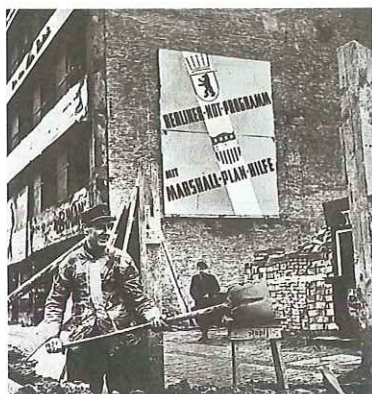
Aufbau in West-Berlin mit Hilfe des Marshallplans

Lesen Sie die Texte. Welche Informationen aus Aufgabe 1 finden Sie wieder? Unterstreichen Sie wie in den Beispielen.