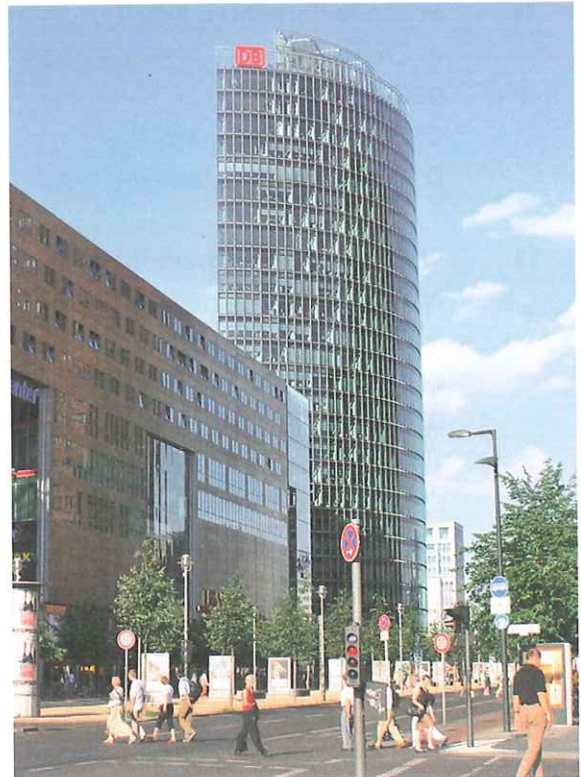
Der Potsdamer Platz heute