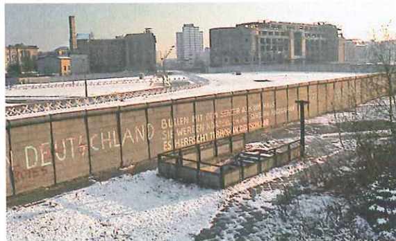
Der Potsdamer Platz im Jahr 1975