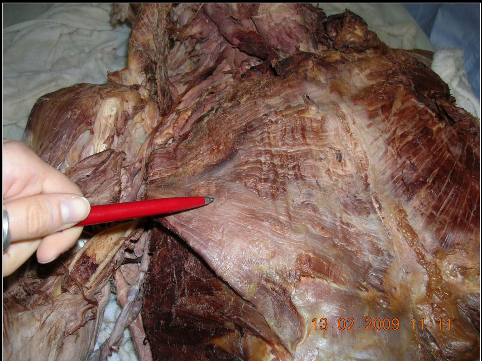
Μείζων θωρακικός μυς με κλειδική, στερνοπλευρική και κοιλιακή έκφυση και κατάφυση σε ακρολοφία μείζονος βραχιονίου ογκώματος