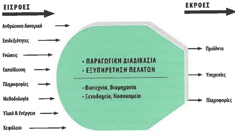
Σχήμα 1.1. Η επιχείρηση ως ανοικτό σύστημα

σε τελικά αγαθά ή υπηρεσίες, που είναι οι εκροές της. Με άλλα λόγια, ό,τι παράγει μια εταιρεία είναι οι εκροές της. Σε κανονικές συνθήκες οι εκροές θα πρέπει να είναι μεγαλύτερης αξίας από τις εισροές. Όταν ισχύει αυτό μπορούμε να θεωρούμε τη διαδικασία μετατροπής ως διαδικασία προστιθέμενης αξίας.