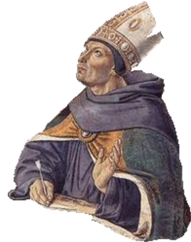
Αυγουστίνος του Ιππών