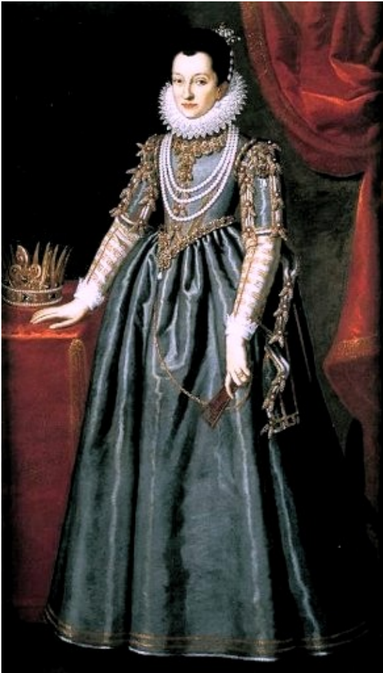
Χριστίνα της Λωραίνης, Μεγάλη Δούκισσα της Τοσκάνης (1565-1637)