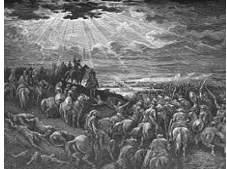
Gustave Doré, Ο Ιησούς του Ναυή

«Τότε ελάλησεν ο Ιησούς προς τον Κύριον, (...) και είπεν ενώπιον του Ισραήλ, Στήθι, ήλιε, επί την Γαβαών, και συ σελήνη, επί την φάραγγα Αιαλών. Και ο ήλιος εστάθη, και η σελήνη έμεινεν, εώσου ο λαός εκδικηθή τους εχθρούς αυτού. (...) Και εστάθη ο ήλιος εν των μέσω του ουρανού, και δεν έσπευσε να δύση έως μίας ολοκλήρου ημέρας»