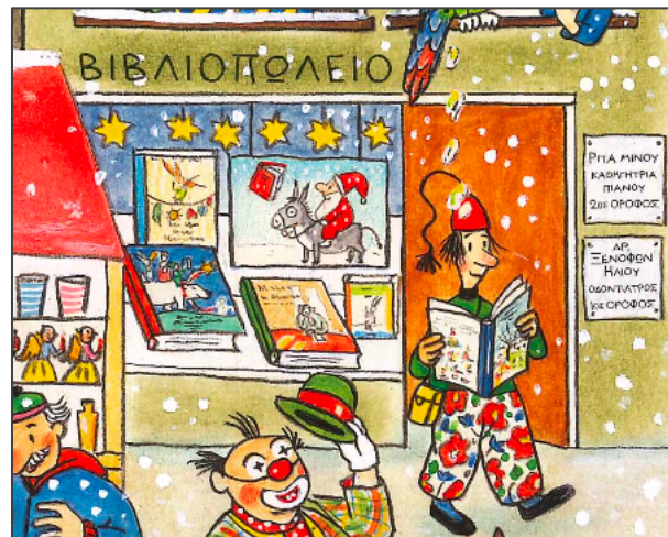
Εικόνα 4. Βιβλίο του Χειμώνα. Λεπτομέρεια εικονογράφησης, όπου παρουσιάζονται γνώριμα εξώφυλλα βιβλίων στο βιβλιοπωλείο,

Μία δεύτερη περίπτωση είναι υιοθέτηση ενός διεικονικού δικτύου με έργα άλλων συγγραφέων/εικονογράφων. Στο βιβλίο του Φθινοπώρου (Bernier, 2021β), εμφανίζονται αρκετές διεικονικές νύξεις, όπως το κάδρο, στο υπνοδωμάτιο της Μαρίας και του Νικόλα με τον Nils Holgersson (Lagerlöf, 1907), το βιβλίο με τον Τεν τεν (“Tim und Struppi”, Hergé, 1929) στο ξυλόσπιτο στο δέντρο, στο πρώτο δισέλιδο, ή το βιβλίο “Hans Christian Andersen Märchen” (Heidelbach, 2010) στη βιτρίνα του βιβλιοπωλείου (Εικ.4).