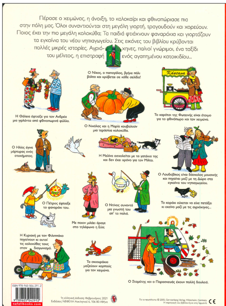
Εικόνα 1: Βιβλίο του Φθινοπώρου. Στο οπισθόφυλλο παρουσιάζονται οι βασικοί χαρακτήρες

διεργασίες που είναι ιδιαίτερα σημαντικές καθώς η παιδική λογοτεχνία στοχεύει κυρίως να καθοδηγήσει και να ενισχύσει την αυτο-ανάπτυξη ενός παιδιού αναγνώστη και τη σύνδεσή του με τον κόσμο (Arizpe στο Sidiroroulou, 2024, σ.236 . Ακόμη και όταν τα ρούχα του αλλάζουν ανάλογα με την εποχή, η οπτική του εμφάνιση παραμένει αναγνωρίσιμη, παρέχοντας μια αίσθηση συνέχειας και συνοχής ανάμεσα στα βιβλία της σειράς (Εικ.1).