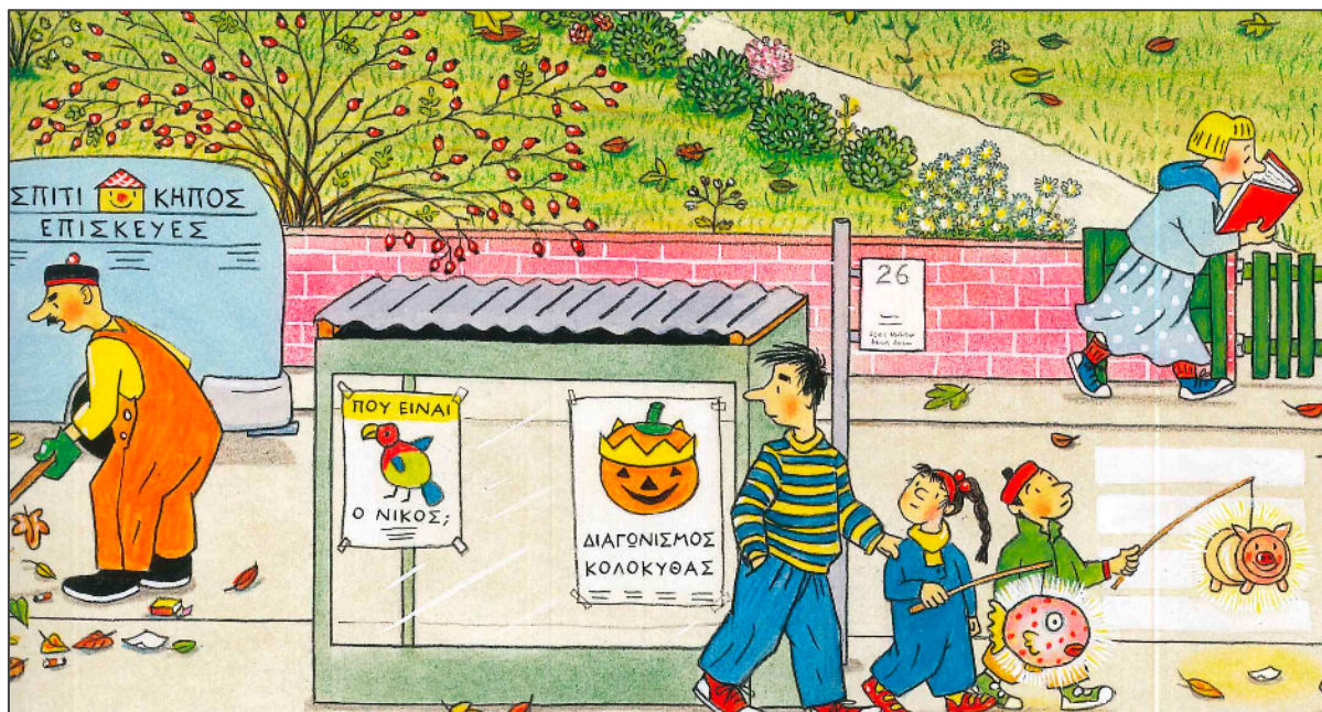
Εικόνα 3: Βιβλίο του Φθινοπώρου. Λεπτομέρεια όπου παρουσιάζεται ενδοεικονικό κείμενο

ενημερώνεται ότι ο Νίκος, ο παπαγάλος, αναζητείται και προϊδεάζεται για τη διεξαγωγή του διαγωνισμού κολοκύθας.