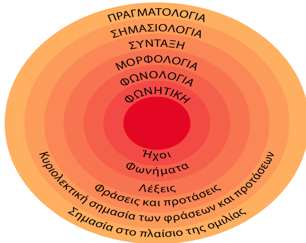
Σχήμα 1.2. Τα επίπεδα της γλώσσας