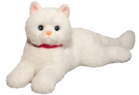
Joy for All