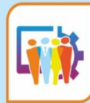
Κέντρα Ημέρας Υποστήριξης Εργαζομένων Αιγάλεω-Πειραιάς