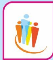
Κέντρο Ημέρας «στο κέντρο της πόλης»