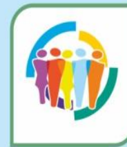
Κέντρο Ημέρας Ενηλίκων - Κινητή Μονάδα Δυτικής Αττικής