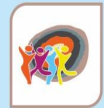
Κέντρο Ημέρας Υποστήριξης Ψυχικής Υγείας μέσω Τέχνης 'Εν-Τεχνη Ψυχή