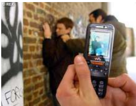
Εικόνα 17: 4gymzografou.wordpress.com

Τα παιδιά θεατές αν και δεν αποτελούν τους δράστες των επιθετικών περιστατικών, παίζουν ιδιαίτερα σημαντικό ρόλο στα περιστατικά σχολικού εκφοβισμού και βίας ενώ ανάλογα με τη στάση που κρατούν διευκολύνουν ή λειτουργούν ανασταλτικά στην επανεμφάνιση παρόμοιων περιστατικών και γενικά στη διαίωσή τους. Αλλά βέβαια τα παιδιά επηρεάζονται το καθένα