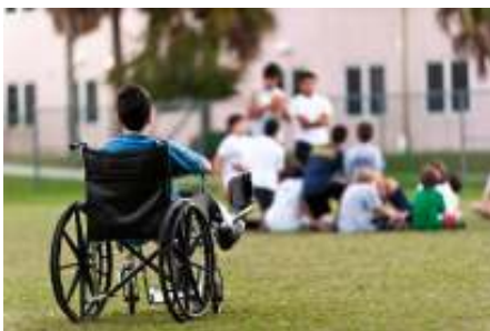
Εικόνα 3: Earned Income Credit for Disabled Children | Earned Income Credit earned-income-credit.com

Β. Συναισθηματικός: Πρόκειται κυρίως για έμμεση μορφή εκφοβισμού. Ο συναισθηματικός εκβιασμός περιλαμβάνει απειλές, εκβιασμούς, διάδοση κακοηθών και ψευδών φημών υβριστικές ή περιπαικτικές εκφράσεις για τη φυλή, την εθνικότητα, τη θρησκεία, την ταυτότητα αναπηρίας, τη σεξουαλική ταυτότητα του θύματος, επιδιωκόμενη απομάκρυνση των φίλων, απομόνωση ή και άσκηση πίεσης από τους συμμαθητές (Naser, et al., 2003).