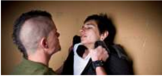
Εικόνα 5: www.onlinecollege.org

Δ. Σωματικός: Ο σωματικός εκφοβισμός αποτελεί την πιο άμεση μορφή