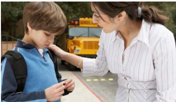
Εικόνα 18: lilysblackboard.org

Σε κάθε περίπτωση πάντως θα πρέπει να καλλιεργείται τέτοιο κλίμα στο