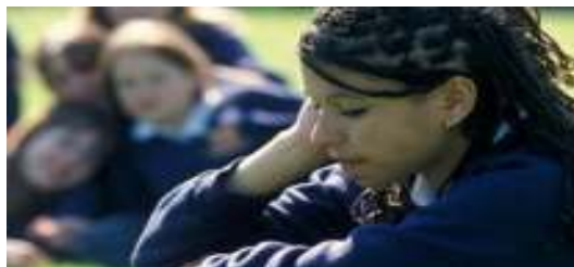
Εικόνα 8: Racist bullying - Racial bullying - Racist bullying of migrants www.schoolbullyingcouncil.com

Ζ. Ρατσιστικός: Πρόκειται για την εκδήλωση λεκτικής, συναισθηματικής ή και σωματικής βίας που στόχο έχουν να προσβάλλουν το θύμα λόγω της καταγωγής του, της κοινωνικής τάξης του, της οικονομικής κατάστασης της οικογένειά τους και γενικά της διαφορετικότητάς του από το σύνολο της πλειοψηφίας