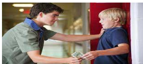
Εικόνα 10: Revealed: Shocking Bullying Statistics 2014!nobullying.com

Η. Εκφοβισμός με εκβιασμό (extortion): Συνήθως αναφέρεται στην κλοπή ή καταστροφή υλικών αντικειμένων του θύματος, όπως την εκούσια απόσπαση χρημάτων ή προσωπικών αντικειμένων και συνοδεύεται από απειλές ή και τον εξαναγκασμό σε ανεπιθύμητες, αντικοινωνικές πράξεις.