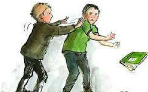
Εικόνα 16: blogs.sch.gr

Αν και το παιδί που εκφοβίζει είναι το ίδιο υπεύθυνο για την ‘κακοποίηση’ του