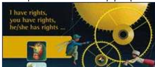
Εικόνα 12: www.coe.int

Το Συμβούλιο της Ευρώπης στην προσπάθειά του να διαφυλάξει τα δικαιώματα του παιδιού συγκρότησε το πρόγραμμα «Χτίζοντας με τη βοήθεια των παιδιών μια Ευρώπη για τα παιδιά» ( www.coe.int/children ), το οποίο ασχολείται με την προώθηση των δικαιωμάτων των παιδιών και με την προστασία των παιδιών από τη βία.