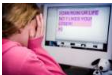
Εικόνα 9: Blog do IPOG - Page 5 www.ipog.edu.br

Θ. Ηλεκτρονικό bullying/cyber bullying: Το cyberbullying περιγράφεται ως "η επαναλαμβανόμενη και εκ προθέσεων βλάβη που προκαλείται διαμέσου της χρήσης ηλεκτρονικών υπολογιστών, κινητών τηλεφώνων και άλλων ηλεκτρονικών συσκευών" και εμφανίζεται συχνότερα σε ιστότοπους όπου συγκεντρώνεται μεγάλος αριθμός εφήβων. Χαρακτηριστικά παραδείγματα αποτελούν η αποστολή υβριστικού ή απειλητικού υλικού μέσω e-mails και των υπηρεσιών MMS και SMS των κινητών τηλεφώνων και των διαδικτυακών τόπων κοινωνικής δικτύωσης, ή τον αποκλεισμό ενός ατόμου από μια δικτυακή ομάδα ή επαναλαμβανόμενες κλήσεις στο κινητό του από άγνωστο νούμερο.