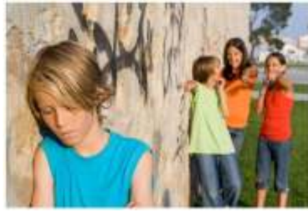
Εικόνα 1: www.boro.gr

Ο σχολικός εκφοβισμός έχει επικρατήσει με τον αγγλικό όρο ‘bullying’ μιας και στην Ελληνική γλώσσα και βάσει ελληνικής βιβλιογραφίας αποδίδεται με διάφορες ονομασίες όπως «εκφοβισμός / θυματοποίηση», «Σχολικός εκφοβισμός», «σχολική επιθετικότητα», «κακοποίηση