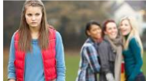
Εικόνα 4: thinkinc.org.au

Α. Λεκτικός: Πρόκειται για άμεση μορφή εκφοβισμού, ο οποίος περιλαμβάνει τη χρησιμοποίηση υβριστικών ή περιπαικτικών εκφράσεων, χρήση παρατσουκλιών, πειραγμάτων, απειλών, εκβιασμών, αγενών σχολίων και ειρωνείας ή και άλλου είδους κοροϊδευτικών και σαρκαστικών εκφράσεων που απευθύνονται σκόπιμα από κάποιο άτομο ή ομάδα ατόμων σε κάποιο άλλο προκειμένου να τον πληγώσουν (Barone, 1997; Smith & Sharp, 1994). Δεδομένου ότι αναφέρεται σε διάπραξη προφορικών επιθέσεων είναι δύσκολο να διευθετηθεί, ακόμα και όταν γίνεται αναφορά στους εκπαιδευτικούς ή και σε άλλους ενήλικες, εφόσον αυτοί που τον ασκούν πάντα το αρνούνται, και ειδικά στις περιπτώσεις που δεν υπάρχουν χειροπιαστές αποδείξεις και μαρτυρίες από τους παρευρισκόμενους μάρτυρες (Van Niekerk, 1993).