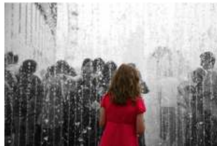
Εικόνα 2: Beyond the Borderline Personality: Alone in the Dark – Social

Γ. Ψυχολογικός: Πρόκειται για έμμεση μορφή εκφοβισμού, όπου τα θύματα βιώνουν εσκεμμένα σε μεγάλη συχνότητα αποκλεισμό από κοινωνικές ή/και ομαδικές δραστηριότητες, κοινωνική απομόνωση ή αποκλεισμό από το παιχνίδι στα διαλείμματα. Όπως και στον συναισθηματικό εκβιασμό και εδώ τα θύματα μπορεί να είναι αποδέκτες δυσφήμισης και κακοπροαίρετων κουτσομπολιών ή επεισοδίων με στόχο τη γελοιοποίησή τους (Whitney & Smith,