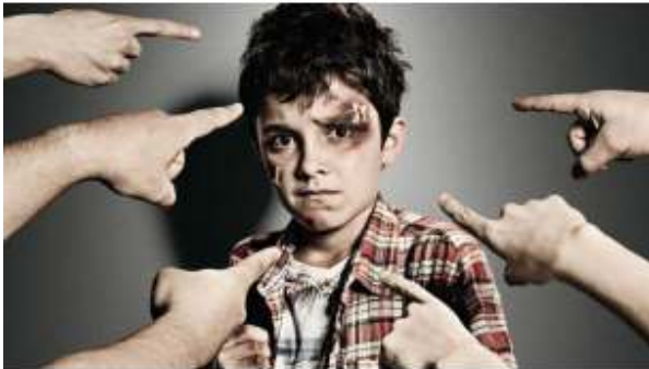
Εικόνα 15: enallaktikidراسi.com

Γενικά, το παιδί που βιώνει τον εκφοβισμό διακατέχεται από το αίσθημα του