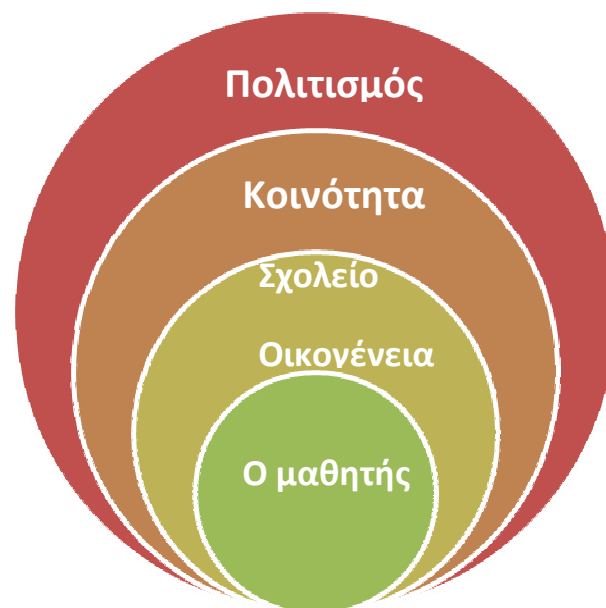
Εικόνα 11 Παράγοντες που επιδρούν αναφορικά με το σχολικό εκφοβισμό (Fried & Fried, 1996:7)

Ο σχολικός εκφοβισμός και η βία αποτελεί ένα πολυδιάστατο φαινόμενο που τείνει να εξαπλώνεται ανησυχητικά τόσο στην Ελλάδα όσο και διεθνώς, με τεράστιες αρνητικές συνέπειες ως προς τη διαμόρφωση ‘υγιών’ αυριανών πολιτών. Για το λόγο αυτό θα πρέπει να καταστεί σαφές το πλαίσιο διάγνωσής του και να αναλυθεί ως προς τις διάφορες διαστάσεις του, οι οποίες είτε αναφέρονται στα αίτια ή στα αποτελέσματα ή ακόμα και στην αντιμετώπιση της παθογόνου αυτής κατάστασης. Συγκεκριμένα θα επιχειρήσουμε να διερευνήσουμε το φαινόμενο του σχολικού εκφοβισμού ως προς τις νομικές, παιδαγωγικές, ψυχολογικές και κοινωνικές του διαστάσεις. Μάλιστα σύμφωνα με το κοινωνικό-οικολογικό μοντέλο των Fried & Fried (1996:6-8) η επιθετικότητα των ανηλίκων που εκδηλώνεται με τη μορφή της σχολικής βίας είναι το αποτέλεσμα διαφόρων παραγόντων που επιδρούν στο ανήλικο άτομο, όπως ο πολιτισμός, η κοινότητα, το σχολείο, η οικογένεια και προσωπικά θέματα. Οι παράγοντες αυτοί αναπαρίστανται ως πέντε ομόκεντροι κύκλοι με τον μαθητή στο επίκεντρο.