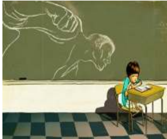
Εικόνα 14: Το παιδί που βιώνει εκφοβισμό » blogs.sch.gr

Ως προς την προσωπικότητά του ή τις συναισθηματικές συνέπειες θα διακρίνεται από: