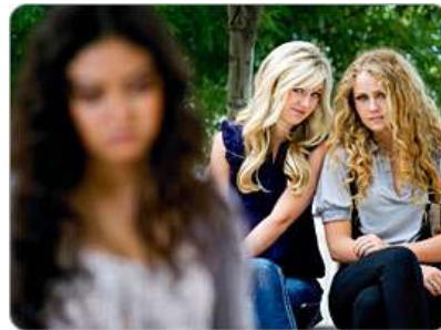
Εικόνα 6: Nouvelles et articles en vedette - AboutKidsHealth

Έμμεσα εκδηλώνεται με 'σιωπηλό' αποκλεισμό ο οποίος γίνεται αντιληπτός από το θύμα μόνο όταν επιχειρήσει να συμμετέχει στη συγκεκριμένη ομάδα (Coloroso, 2003:17; Lee, 2004:10).