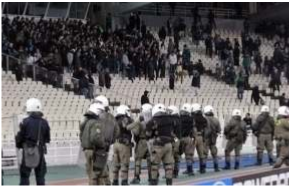
Εικόνα 19: www.grreporter.info

Επιπλέον, ο σχολικός εκφοβισμός ως ενέργεια μίμησης συμπεριφορών ενηλίκων, θα πρέπει να διερευνηθεί τόσο στο μικρο-επίπεδο του σχολείου και της οικογένειας, αναλύοντας τις διαπροσωπικές σχέσεις και τη συνεργασία του εκπαιδευτικού προσωπικού και τη συμπεριφορά των γονιών τόσο μεταξύ τους αλλά και απέναντι στα παιδιά τους αλλά και στο μακρο-επίπεδο της κοινωνίας μας τόσο μέσα από την υπερβολική μας έκθεση σε βίαιες πράξεις (gratuitous violence) από τα ΜΜΕ (ταινίες, ειδήσεις, ακόμα και παιδικά προγράμματα) όσο και σε παγιωμένες κοινωνικές καταστάσεις (βιαιοπραγίες μεταξύ αστυνομικών και διαδηλωτών, χουλιγκανισμός, κλπ.), οι οποίες εκπέμπουν λανθασμένα μηνύματα στα νεαρά άτομα. Για παράδειγμα, ο χουλιγκανισμός μπορεί να γίνει αντιληπτός ως ηρωική πράξη, εφόσον κάποιος 'υπερασπίζεται' την ομάδα του.