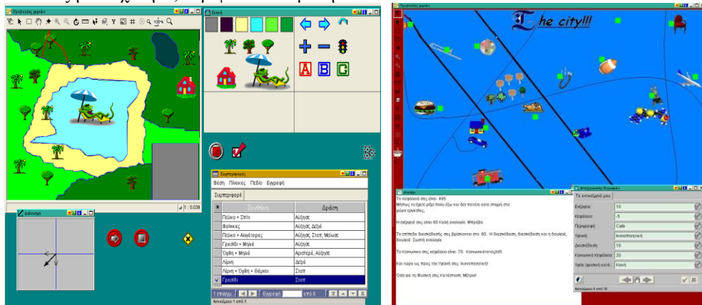
Εικόνα 2. «Περιήγηση στο πάρκο» (αριστερά) «Περιπέτειες στην πόλη» (δεξιά)

πάρκο» (βλ. εικ.2). Στο μικρόκοσμο αυτό ο μαθητής έχει τη δυνατότητα να ορίσει και να περιγράψει τη συμπεριφορά μίας κινούμενης οντότητας συνθέτοντας με την χρήση εικονικών συμβόλων εκφράσεις του τύπου συνθήκη – δράση: π.χ. αν βρεθείς στη λίμνη τότε αύξησε ταχύτητα, στρίψε και σταμάτησε.