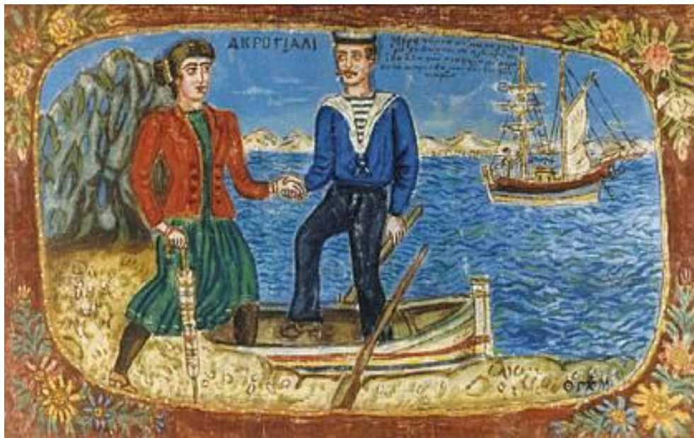
«Ακρογιάλι». Ελαιογραφία σε ύφασμα

Woodard, L. J. (2004). Sexuality and disability. Clinics in Family Practice , 6, 941–954.