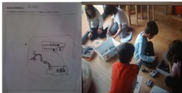
Εικόνα 1: Αναπαράσταση Ρομπότ; Ο Σπύρος, το ρομπότ, η ομάδα

κανένας από τους δύο γονείς δεν είναι γνώστες τεχνολογίας. Όσον αφορά τα ρομπότ, γνωρίζει πως συνήθως είναι ανθρωπόμορφα αλλά μπορούν να έχουν ποικίλες μορφές και πολλές διαφορετικές λειτουργίες. Αντιλαμβάνεται σαφέστατα πως οι ρομποτικές κατασκευές δε λειτουργούν απόλυτα αυτόνομα και ότι δρουν βάσει της συνεργασίας «μηχανισμών» και «εντολών» που λαμβάνουν μέσω ανθρώπινης παρέμβασης. Έχει ξεκάθαρη ιδέα για το τι ακριβώς είναι οι αισθητήρες και είναι σε θέση να ενσωματώσει ανάλογες συσκευές σε κατασκευές Lego. Την ικανότητα και τη πρότερη εμπειρία του την αποδεικνύει στη φάση της κατασκευής όπου αναλαμβάνει εξ' αρχής πρωταγωνιστικό ρόλο έναντι της Ραφαέλας και του Χρήστου, οι οποίοι λειτουργούν κατά κάποιο τρόπο ως "βοηθοί" του. Μάλιστα, σ' εκείνη τη φάση ο Σπύρος δε χρειάζεται να συμβουλευτεί ιδιαίτερα τον οδηγό συναρμολόγησης που είχαμε μοιράσει στα παιδιά.