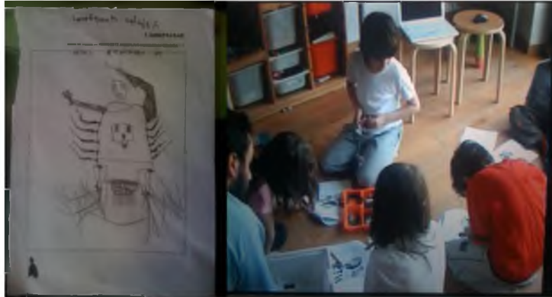
Εικόνα 2: Αναπαράσταση Ρομπότ, Ο Άγγελος, το ρομπότ, η ομάδα