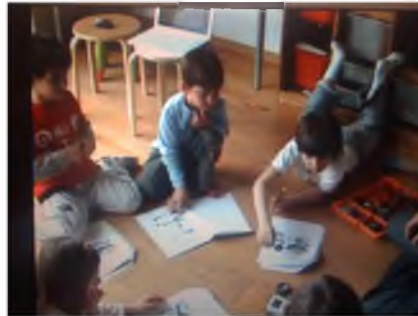
Εικόνα 4: Χρήστος το ρομπότ και η ομάδα εργασίας

δραστηριότητας αν και στο κατασκευαστικό κομμάτι ο ρόλος του στην ομάδα είναι κάπως περιορισμένος. Εκδηλώνει ιδιαίτερο ενδιαφέρον για το θέμα και προσπαθεί να μην υστερήσει σε σχέση με τα μεγαλύτερα, απ' αυτόν, παιδιά.