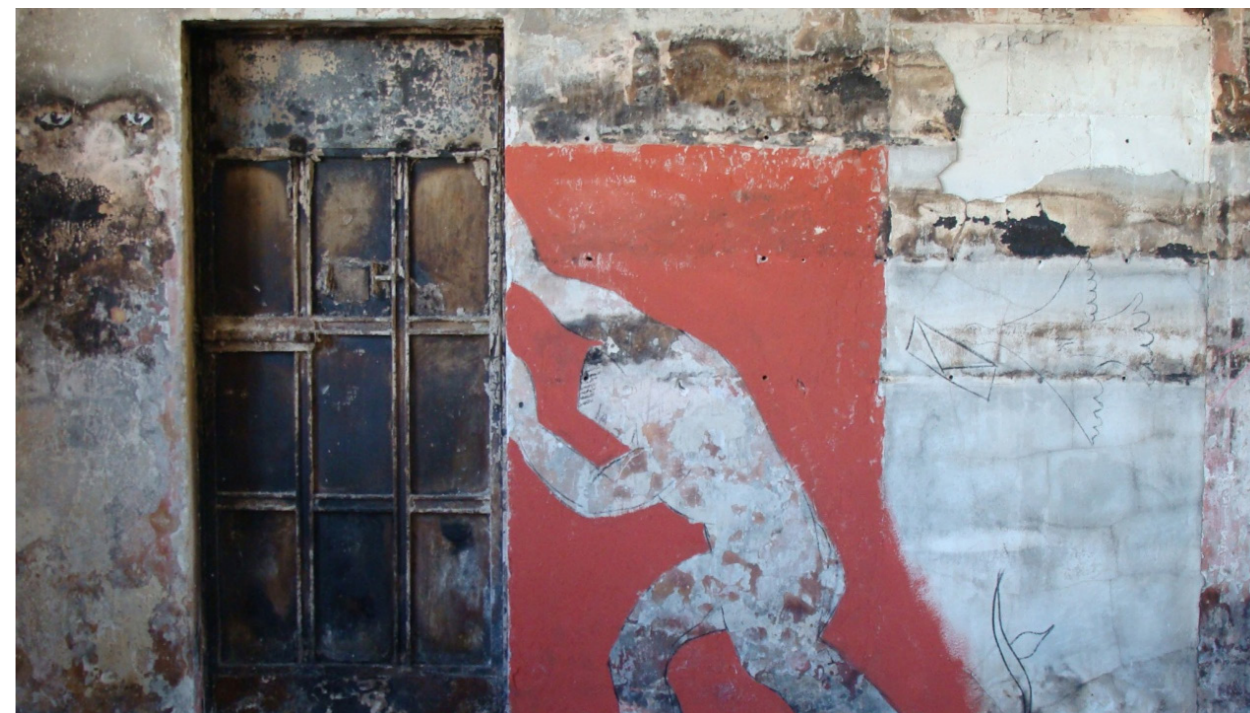
Εικόνα 2: Κρατώντας τη φυλακή εκτός της Θεραπευτικής Κοινότητας, Αρχείο ΚΕΘΕΑ.

Στις 4 Ιουνίου 2006 συνέβη μία κινηματογραφική απόδραση από τις φυλακές Κορυδαλλού, όταν ένα μικρό ελικόπτερο προσγειώθηκε στο προαύλιο της φυλακής και παρέλαβε δύο κρατουμένους, τον Βασίλη Παλαιωκώστα και τον Αλκέτ Ριζάι. Αυτός ο χώρος μετατράπηκε με τη δημιουργία της θεραπευτικής κοινότητας ΚΕΘΕΑ ΕΝ ΔΡΑΣΕΙ σε χώρο προς την ελευθερία μέσω της νόμιμης οδού για άλλους κρατούμενους χρήστες ψυχοτρόπων ουσιών. Η θεραπευτική κοινότητα που κατασκευάστηκε με τη συμμετοχή των κρατουμένων χρηστών λειτουργήσε αποτελεσματικά μέχρι τη στιγμή που ξέσπασε μία μεγάλη πυρκαγιά μετά από εξέγερση κρατουμένων, το Σεπτέμβριο του 2012. Η πυρκαγιά κατέστρεψε ολοσχερώς όλο