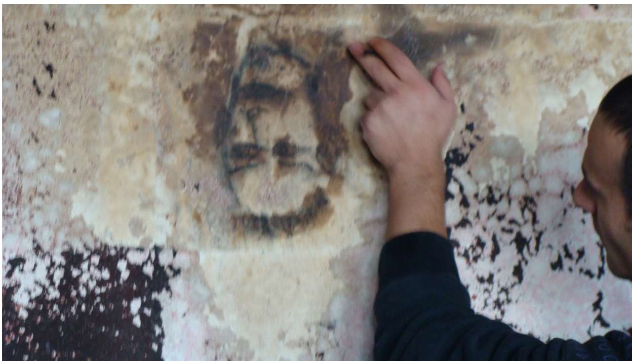
Εικόνα 1: Ζωγραφίζοντας στα συνιρίμια της φυλακής, Αρχείο ΚΕΘΕΑ.

κάθε φυλακή έχει τη δική της παράδοση και ιστορία που είναι πλούσια σε μύθους, ήρωες, τελετουργίες και συμβολισμούς. Αυτή η ιστορία, που έχει την αφετηρία της πριν από το κτίσιμο της φυλακής, διαμορφώνει ιδέες, συνήθειες, πεποιθήσεις και καλλιέργει μία κουλτούρα που επηρεάζει τη συμπεριφορά του προσωπικού και των κρατουμένων και δημιουργεί μία ιδιαίτερη αντίληψη για τον έλεγχο και τη φροντίδα τους, αλλά και για τον ίδιο τον χώρο.