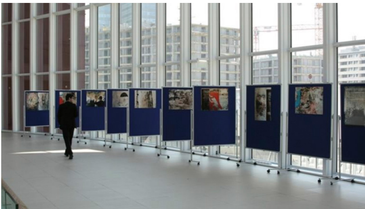
Εικόνα 5: Έκθεση: «Κοινότητες στη Φυλακή: Παράθυρο στην Κοινωνία», ΟΗΕ, Βιέννη, 2014. 3

και το θεραπευτικό προσωπικό ήταν να αποφύγουν τα στερεότυπα μοτίβα της φυλακής που βρίσκονται στους τοίχους ή στα σώματα των κρατουμένων και που συνήθως αναπαριστούν έναν «σταυρό», τον «Εσταυρωμένο», «κάγκελα», «σύρματα», «γυναίκες αγγέλους», «Παναγίες ή πόρνες». Θα λειτουργούσαν επομένως μέσα σε ένα νέο πλαίσιο με κανόνες, όπου θα αναζητούσαν με τη φαντασία τους νέα σχήματα και εικόνες, υπερβαίνοντας την ιδιότητα του κρατουμένου υπό θεραπεία. Η προϋπόθεση ήταν να αξιοποιήσουν τον τοίχο σαν έναν μεγάλο καμβά, αλλά και να αναζητήσουν μέσα από τις ρωγμές και τις καμένες επιφάνειες του, αυθόρμητα εικόνες, σχήματα και μορφές που με τη δική τους παρέμβαση θα μπορούσαν να μετατραπούν σε καλλιτεχνικό έργο. Με τον τρόπο αυτόν, χωρίς να το γνωρίζουν, υπάκουσαν σε μία βασική αρχή στην οποία ο Λεονάρντο Ντα Βίντσι προέτρεπε τους εκπαιδευόμενους καλλιτέχνες, δηλαδή, «[...] όταν θέλουν να ζωγραφίσουν μία τοιχογραφία, να μην ψάχνουν αφηρημένες ιδέες μέσα στο μυαλό τους, αλλά να κοιτάξουν μπροστά τους τον ίδιο τον τοίχο που προτίθενται να ζωγραφίσουν και να δουν μέσα από τις ρωγμές και τα σημάδια του χρόνου επάνω του, να αναδύονται οι εικόνες και οι μορφές που θα ζωγραφίσουν» (Ζαχαρόπουλος 2013). Προτεραιότητα συνεπώς δόθηκε στο έργο, αλλά παράλληλα, το έργο αποτέλεσε αφορμή για βαθύτερη διεργασία.