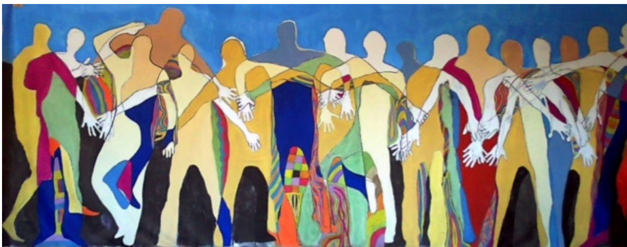
Εικόνα3: «Είμαστε εδώ και συνεχίζουμε ενωμένοι», Αρχείο ΚΕΘΕΑ.

καλλιτεχνών και φιλοσόφων με ειδική σημασία, μέσω αναπαραστάσεων και συμβόλων.