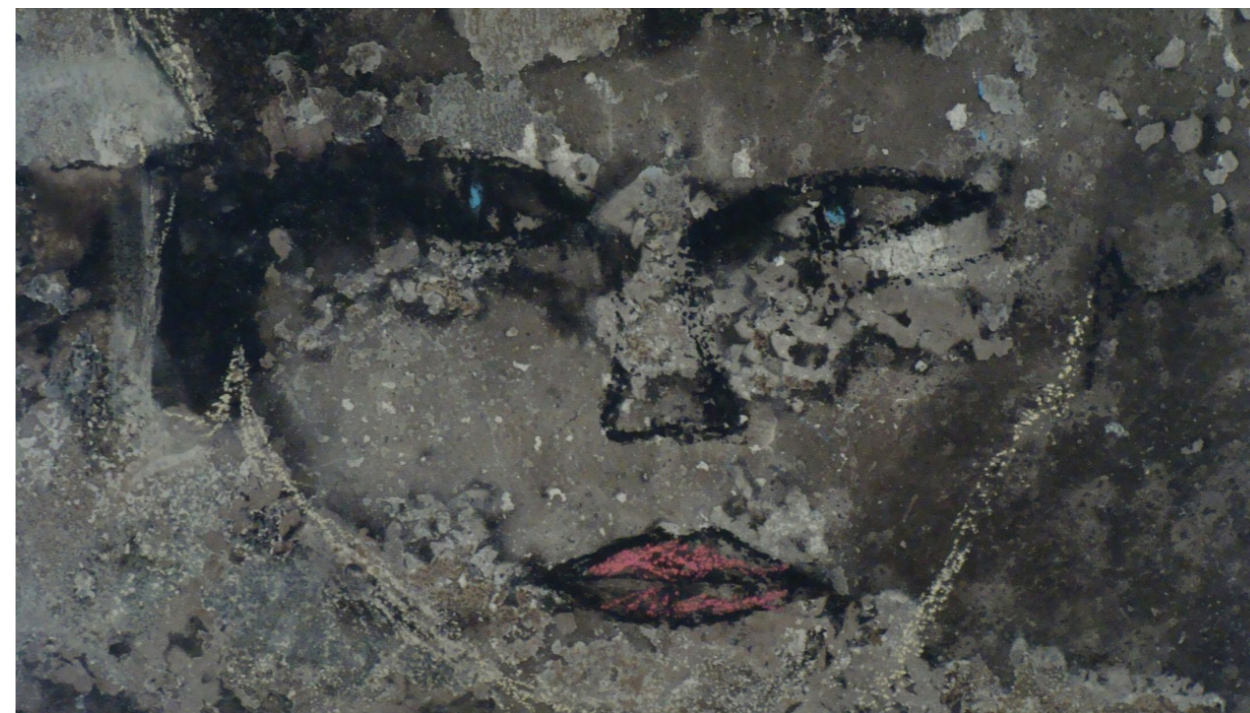
Εικόνα 4: Μορφή στον καμένο τοίχο της φυλακής.

Οι Ιάπωνες χρησιμοποιούν τη λέξη ma για να περιγράψουν το «ενδιάμεσο» που διαμορφώνει το όλον. Αυτός ο ενδιάμεσος χώρος αναπαρίσταται από ένα ιδεόγραμμα που αποτελείται από δυο στοιχεία. Τα δύο φύλλα μίας πόρτας και ένα άνοιγμα μέσα από το οποίο περνάει το