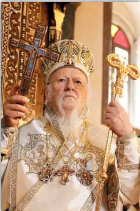
† Ἡ Αὐτοῦ Θειοτάτη Παναγιότης ὁ Οἰκουμενικός Πατριάρχης κ.κ. ΒΑΡΘΟΛΟΜΑΙΟΣ