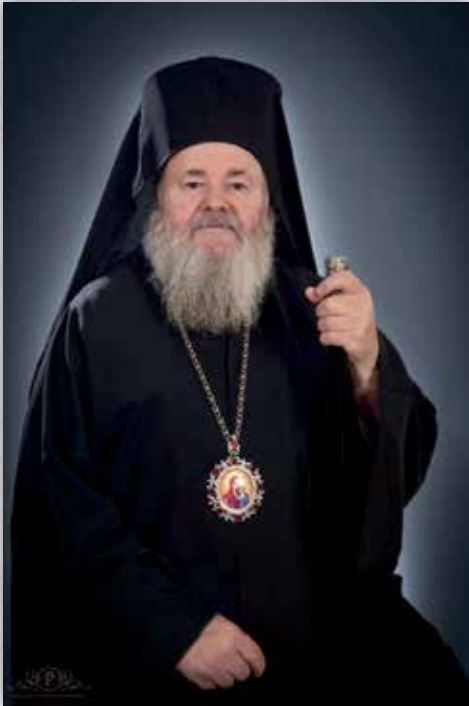
† Ὁ Σεβασμιώτατος Μητροπολίτης Κυδωνίας & Ἀποκωρώνου κ. ΔΑΜΑΣΚΗΝΟΣ

Σ' ὅτι ἀφορᾶ τὴν ἀνθρώπινη σοφία (ὅπου ἐμπερικλείεται καί ἡ ἐπιστήμη) διευκρινίζεται ἀγιογραφικά: «Κύριος αὐτὸς ἔκτισεν αὐτὴν καὶ εἶδε καὶ ἐξηρίθμησε αὐτὴν ἐπὶ πάντα τὰ ἔργα αὐτοῦ μετὰ πάσης σαρκὸς κατὰ τὴν δόσιν αὐτοῦ καὶ ἐχορήγησεν αὐτὴν τοῖς ἀγαπῶσιν αὐτὸν» (Σοφία Σειράχ 1, 9-10). «Καὶ αὐτὸς ἔδωκεν