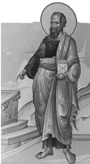
Ο Απόστολος Παύλος.

δίαυλο προς επίτευξη του «μεταδοτικού του σκοπού». Κατά τη δεύτερη Αποστολική του περιοδεία, γύρω στο 50 με 53 μ.Χ, συμπεριέλαβε στα επεκτατικά του σχέδια, αναφορικά με τη Χριστιανική πίστη, σημαντικές πόλεις της Ελλάδος, όπως τη Θεσσαλονίκη, τη Βέροια, τους Φιλίππους, την Κόρινθο και την Αθήνα. 5 Οι Πράξεις των Αποστόλων 6 μας διασώζουν σημαντικές πληροφορίες σχετικά με την παρουσία του Απ. Παύλου στην περιώνυμη πόλη των Αθηνών, καίτοι την εποχή αυτή που την επισκέπτεται ο Παύλος, η λαμπρά και σημαντική πόλη της Παλλάδος έχει χάσει την αίγλη της, έχοντας οδηγηθεί σε μια εποχή απραξίας. 7 Παρά ταύτα δεν είχε εκλείψει η βαθιά ευσέβεια την οποία έτρεφαν οι κάτοικοί της στην καρδιά τους, αλλά και ο πόθος για την αναζήτηση της αλήθειας και του φιλοσοφικού στοχασμού. 8