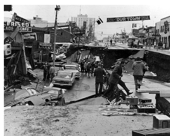
Η 5η λεωφόρος στο Ανκορατζ, αμέσως μετά τον καταστροφικό σεισμό του 1964

Η προϊστορία του εκχριστιανισμού. Αυτές οι επαφές ξεκίνησαν με τις εξερευνητικές αποστολές του Δανού Βίτους Μπέριγκ, στο όνομα του τσαρικού στέμματος, με απόφαση του Μεγάλου Πέτρου, μετά τον Μεγάλο Βόρειο Πόλεμο το 1717, και με σκοπό προφανώς την οικονομική εκμετάλλευση των νέων εδαφών, ενδεχομένως και την κατοχύρωση εδαφικών διεκδικήσεων στην αμερικανική ήπειρο. Μετά από πολυετή προετοιμασία, στην πρώτη του αποστολή ο Μπέριγκ κατέπλευσε τον πορθμό που πήρε αργότερα το όνομά του (Βερίγγιος) με στόχο την Αλάσκα,