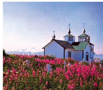
Μεταμόρφωση του Σωτήρος, ορθόδοξος ρωσικός ναός στο Κενάι της Αλάσκας

Το πρώτο ιεραποστολικό κλιμάκιο. Πολύ σύντομα, πράγματι, στην ιεραποστολική αυτή δραστηριότητα ενσωματώθηκαν ιερείς και μοναχοί. Συγκεκριμένα, ο Σελέκωφ ζήτησε από την τσαρίνα Αικατερίνη Β΄ και την Ιερά Σύνοδο της Ρωσικής Εκκλησίας να σταλούν ιερείς, τη συντήρηση των οποίων θα αναλάμβανε η Εταιρία. Όντως, η Μ. Αικατερίνη έστειλε μια πολυπληθής ομάδα που αποτελούνταν από 4 ιερομονάχους, 2 ιεροδιακόνους και 2 μοναχούς, με επικεφαλής τον αρχιμανδρίτη Ιωάσαφ Μπολότωφ. Τα ονόματά τους ήταν Ιωάσαφ, Ιουβενάλιος, Αθανάσιος, Μακάριος, Νεκτάριος, Στέφανος, Μακάριος και Γερμανός. Οι περισσότεροι προέρχονταν από τις ιστορικές και φημισμένες μονές του Βαλαάμ (Βάλαμο) στη σημερινή Φινλανδία και