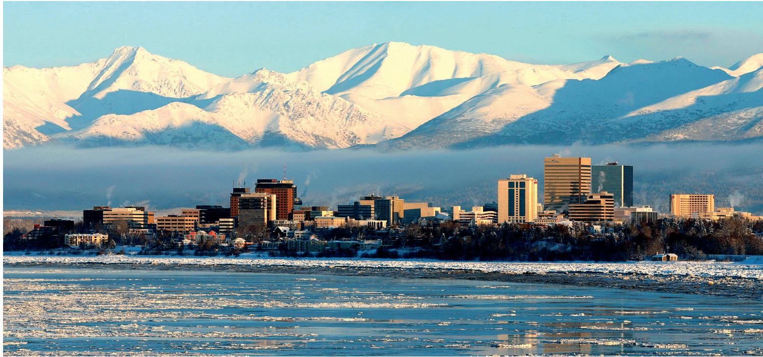
Αποψη του Άνκορατζ, της μεγαλύτερης πόλης της Αλάσκα

Άγιος αναγνωρίστηκε το 1970 και ο απλός μοναχός Γερμανός, από το Βαλαάμ, μια καθαρά πουχαστική μορφή. Εγκαταστάθηκε στο μικρό νησί Ελόβυγ (Spruce), βορειοανατολικά του Κοντιάκ, όπου ίδρυσε πουχαστήριο με το όνομα Νέο Βάλαμο (Βαλαάμ). Ενώ δεν δραστηριοποιήθηκε με ιεραποστολικές περιουσίες, η προσωπική ακτινοβολία του και το παράδειγμά του ήταν τέτοια, που επέδρασαν βαθύτατα στους ιθαγενείς. Ιδίως κατά τη διάρκεια μιας επιδημίας που αποδεκάτισε τους πληθυσμούς, ο π. Γερμανός φρόντισε τους αρρώστους και τους νεκρούς, ενώ περιμάζεψε δεκάδες ορφανά, στα οποία έψνε κουλουράκια με τα χέρια του για να τα χαροποιήσει. Η δύναμή του και η προσωπική ασκητική ζωή του ήταν παροιμιώδεις. Μετά τον θάνατό του διαπιστώθηκε ότι πάνω από το δερμάτινο ιμάτιο, που φορούσε μέχρι να λιώσει, κατάσαρκα ήταν περιζωσμένος με αλυσίδες, οι οποίες διατηρούνται και σήμερα στον ιερό ναό του Κοντιάκ. Παρά τις πάμπολλες δολοφονικές απόπειρες εναντίον του, οργανωμένες από τον Μπορανάφ, έζησε μέχρι βαθιά γεράματα, κοιμήθηκε ειρηνικά στις 15 Νοεμβρίου 1836, και έλαμψε ως το Πολικό αστέρι, όπως τον ονομάζουν οι ντόπιοι, επέδρασε δε βαθύτατα στις ψυχές τους και στις γενιές που ακολούθησαν.