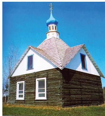
Άγιος Νικόλαος, ορθόδοξος ρωσικός ναός στο Κενάι της Αλάσκας

Τον Αύγουστο του 1784 ο Γρηγόριος Σελέκωφ, Ρώσος έμπορος, κατέπλευσε με το πλοίο «Τρεις Άγιοι» στο νησί Κοντιάκ, τη μεγαλύτερη νήσο στον κόλπο της Αλάσκας. Η μεγάλη διαφορά του από άλλους εμπόρους, που πηγαινοέρχονταν κατά καιρούς και δημιουργούσαν μικρότερη ή μεγαλύτερη αναστάτωση στην ιθαγενή κοινωνία, ήταν πως ο Σελέκωφ ήρθε για να μείνει. Στόχος του ήταν να αποκτήσει το προνόμιο αποκλειστικής εκμετάλλευσης νήσων και Αλάσκας, που θα χορηγούσε στην εταιρία του η Μ. Αικατερίνη, αν αποδεικνυόταν άξιος στον εποικισμό. Έτσι, με εργασία, διπλωματία και τερατώδεις υπερβολές στις αναφορές του, έπεισε την κυβέρνηση για τη χρησιμότητα του εγχειρήματός του και ίδρυσε τη Ρωσοαμερικανική Εταιρία, ένα μονοπώλιο στον αμερικανικό