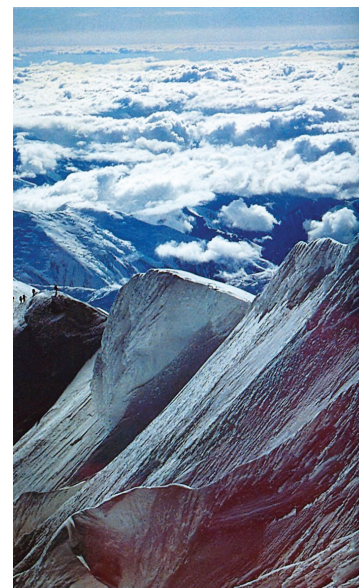
Αλάσκα, όρος McKinley

Εντούτοις, οι ιθαγενείς λαοί έχουν αποδεκατιστεί πληθυσμιακά, γι' αυτό και απομένουν τόσο λίγοι. Ενώ οι συχνές επιμειξίες των Ρώσων εμπόρων με ιθαγενείς γυναικές δημιούργησε μια νέα γενιά, που ζούσε σε δίγλωσσο ή και τρίγλωσσο και συνάμα πολυπολιτισμικό