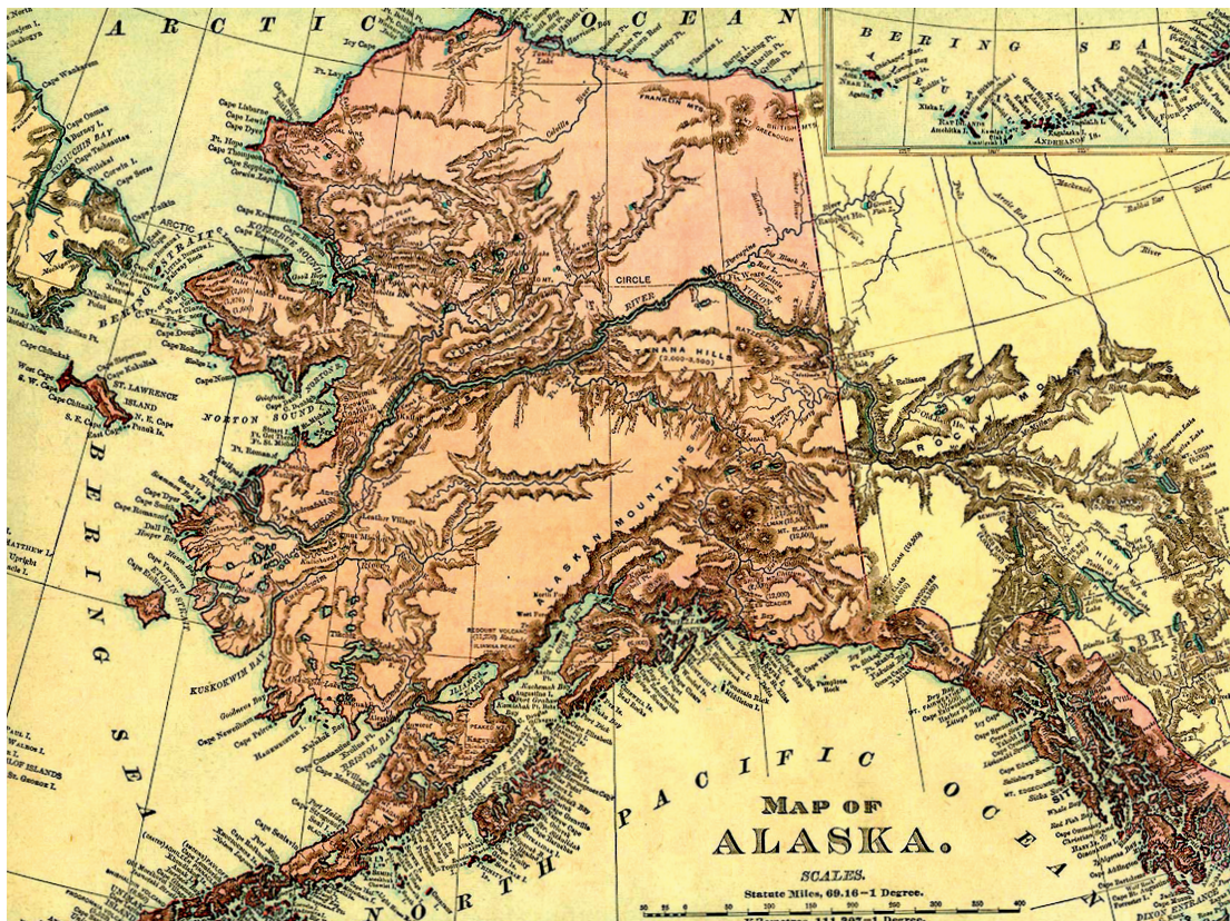
Παλιός χάρτης της Αλάσκα

Λαοί, γλώσσες και θρησκεύματα. Μια πλειοστάδα φυλών ζουν παραδοσιακά στην περιοχή της Αλάσκα και μιλούν τις γλώσσες τους, εκ των οποίων σήμερα σώζονται 22. Διακρίνονται σε τρεις με-