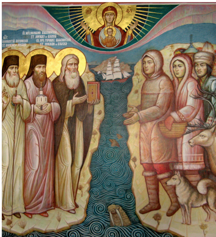
Τοιχογραφία που απεικονίζει τους αγίους Ιννοκέντιο, Ιουβενάλιο και Γερμανό, να ευαγγελίζονται την ορθόδοξη πίστη στους αυτόχθονες της Αλάσκας

την οποία ακτινοβολούσε την αγάπη και την προσφορά της. Η κοιμήσή της στις 8 Νοεμβρίου του 1979 έφερε την άνοιξη στην καρδιά του φθινοπώρου, μέχρι να συγκεντρωθούν όλοι για την ταφή της. Ήδη η μακαριστή Όλγα τιμάται ως αγία, παρότι είναι νωρίς για την επίσημη αναγνώριση και αγιοκατάταξη της. Πολλές μάτουςκες, πολλούς μπάμπουςκες αλλά και νέους ανθρώπους της Ορθοδοξίας θα ήταν ωραίο και χρήσιμο για τη δική μας αυτοσυνειδησία να γνωρίζαμε από πιο κοντά, όπως και την Εκκλησία της Αλάσκας στο σύνολό της. Ε.ΒΟΥΛ.