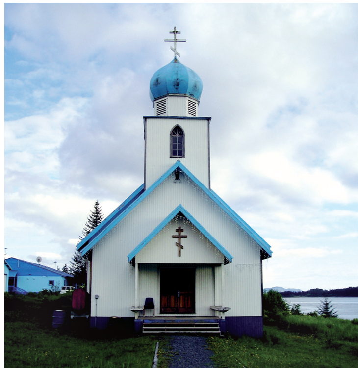
Ορθόδοξος ναός στο χωριό Tatitlek της Αλάσκας

Η Αλάσκα, πεδίο ιεραποστολικού ανταγωνισμού. Με την πώληση της Αλάσκας το 1867, ο άγιος Ιννοκέντιος διείδε μια νέα ευκαιρία, και υποστήριξε τη χρήση της αγγλικής περισσότερο από τη ρωσική, και παράλληλα πάντα με τη χρήση των ιθαγενών γλωσσών. Αντίθετα, οι εισβάλλουσες πλέον μαζί και συστηματικά προτεσταντικές ιεραποστολές επένδυναν μόνο στην πολιτισμική ομογενοποίηση των ιθαγενών μέσω της μονομερούς χρήσης της αγγλικής και κατάργησης των άλλων ιθαγενών γλωσσών.