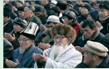
Άριστερά: Προσευχή μουσουλμάνου προσκυνητή από λόφο έναντι της Μέκκας. Κέντρο: Ώρα προσευχής μουσουλμάνων στο Μπαγκλαντές. Δεξιά: Κιργκίσιοι μουσουλμάνοι σε θρησκευτική γιορτή στις 8 Δεκεμβρίου.

Ό,τι ισχύει για κάθε τι στον κόσμο, ισχύει και για το πράγμα θρησκεία. Ό,τι δεν κινείται πλέον, είναι νεκρό. Το αποδεικνύει η Ιστορία Θρησκευμάτων χιλιάδες φορές. Η μεταβολή αποτελεί τη ζωτική δύναμη των θρησκειών.