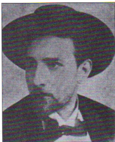
Ο Πιραντέλλο φοιτητής στη Βόννη (1890).