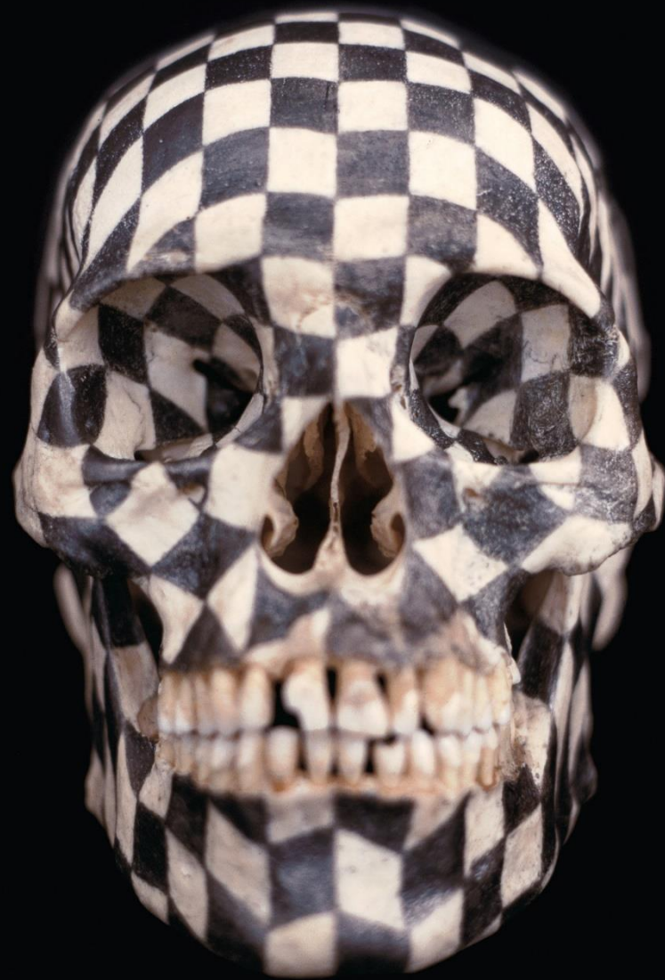
Gabriel Orozco. Black Kites . 1997 Μαύροι χαρταετοί