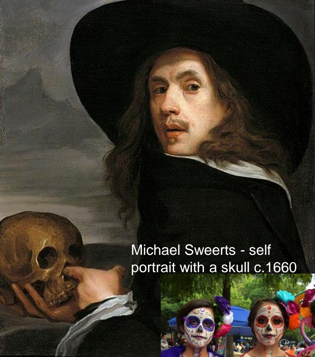
Michael Sweerts - self portrait with a skull c.1660