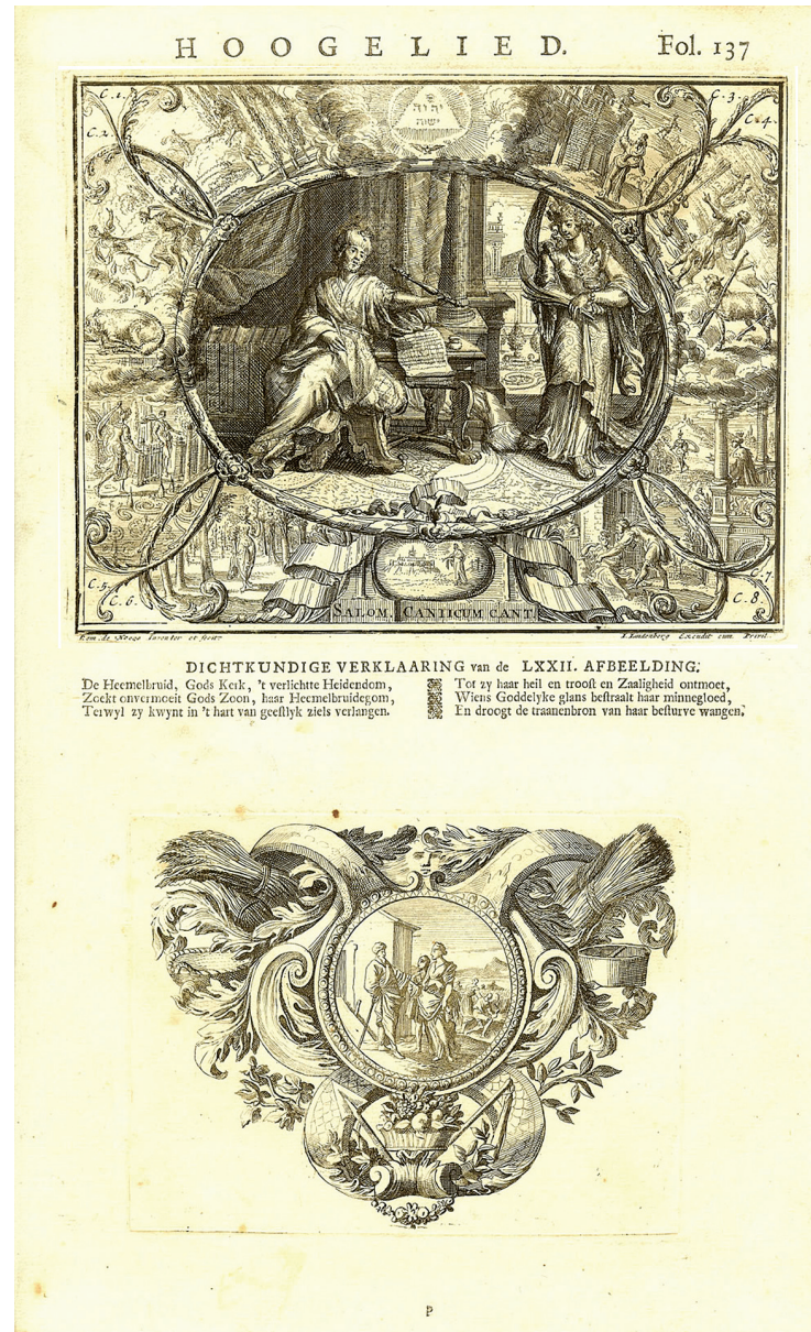
Εικονογράφηση του Άσματος Ασμάτων (1705), έργο του Romeyn de Hooghe, χαράκτης Jacob Lindenberg

ριο της ενόπτιας της Γραφής και της Παραδόσεως στον Χριστό, οφείλουμε να εισέλθουμε σε μια διαφορετική, σε μια εμπειρική πραγματικότητα: οφείλουμε να βιώσουμε οι ίδιοι το μυστήριο της προσωπικής «παραδόσεως» μας στον Χριστό και το Σώμα Του, την Εκκλησία, ακολουθώντας Εκείνον ο οποίος παραδίδεται και μαρτυρείται στον κόσμο και τους ανθρώπους μέσω αυτής. Επομένως, καθώς συμβουλεύει και ο