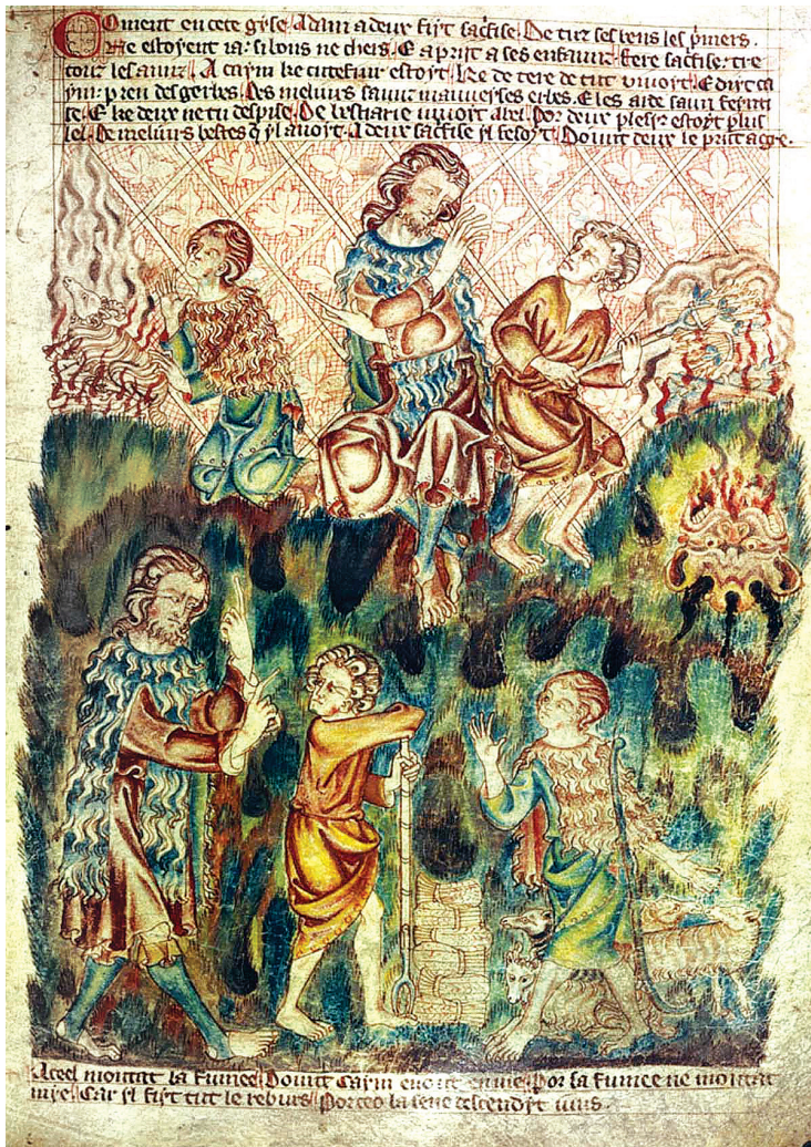
Κάιν και Ἀβελ, από το Holkham Bible Picture Book (περ. 1320-30), BL AddMss 47682, f. 5r (British Library)

Ο Χριστός τούτος εἶναι το «τέλος» (Ρωμ 10:4) και το «πλήρωμα» (βλ. Ρωμ 13:10) του Νόμου και των Προφητῶν, ο «σκοπός» της Γραφής, η αρχή και το τέλος κάθε θεολογίας, κατὰ τον ἅγιο Κύριλλο Ἀλεξανδρείας (βλ. Περὶ τῆς ἐν πνεύματι και ἀληθείᾳ προσκυνήσεως και λατρείας, Λόγος γ' , PG 68:268: Πλαφυρά εις τὴν Γενεσιν, Λόγος στ' , PG 69:305), ο παραδίδων και παραδιδόμενος αυτοπροσώπως «διὰ τὴν ἡμέτεραν σωτηρίαν» (Σύμβολο Νικαίας-Κωνσταντινουπόλεως), ο προς βρώσιν αεί διδόμενος «ὑπὲρ τῆς τοῦ κόσμου ζωῆς» (Ιω 6:51). Εκείνος, εν κατακλείδι, εἶναι η πηγή της Παραδόσεως, το κέντρο, η αρχή και το τέλος της. Αυτὸν προσλαμβάνει ο πρῶν διώκτης Σαῦλος ως αντικείμενο και υποκείμενο της χριστιανικῆς παραδόσεως, ἔστω κι αν δεν ἔχει ζήσει οὔτε στιγμή σωματικῶς κοντά Του. Εκείνον εξακολουθεῖ να παραλαμβάνει και να παραδίδει σ' εμάς, δύο χιλιάδες χρόνια μετὰ, η Εκκλησία Του, αφοῦ ο ίδιος εἶναι, κατὰ τον ἱερό Χρυσόστομο, «ὁ πάντα ἐργαζόμενος και παραδιδούς, ὡσπερ και τότε» ( Εἰς τὴν προς Κορινθίους α' , Ομιλία κζ', PG 61:229). Εκείνος εἶναι ο παραδιδόμενος, μαζὶ με τη θεανδρική ζωή Του, η