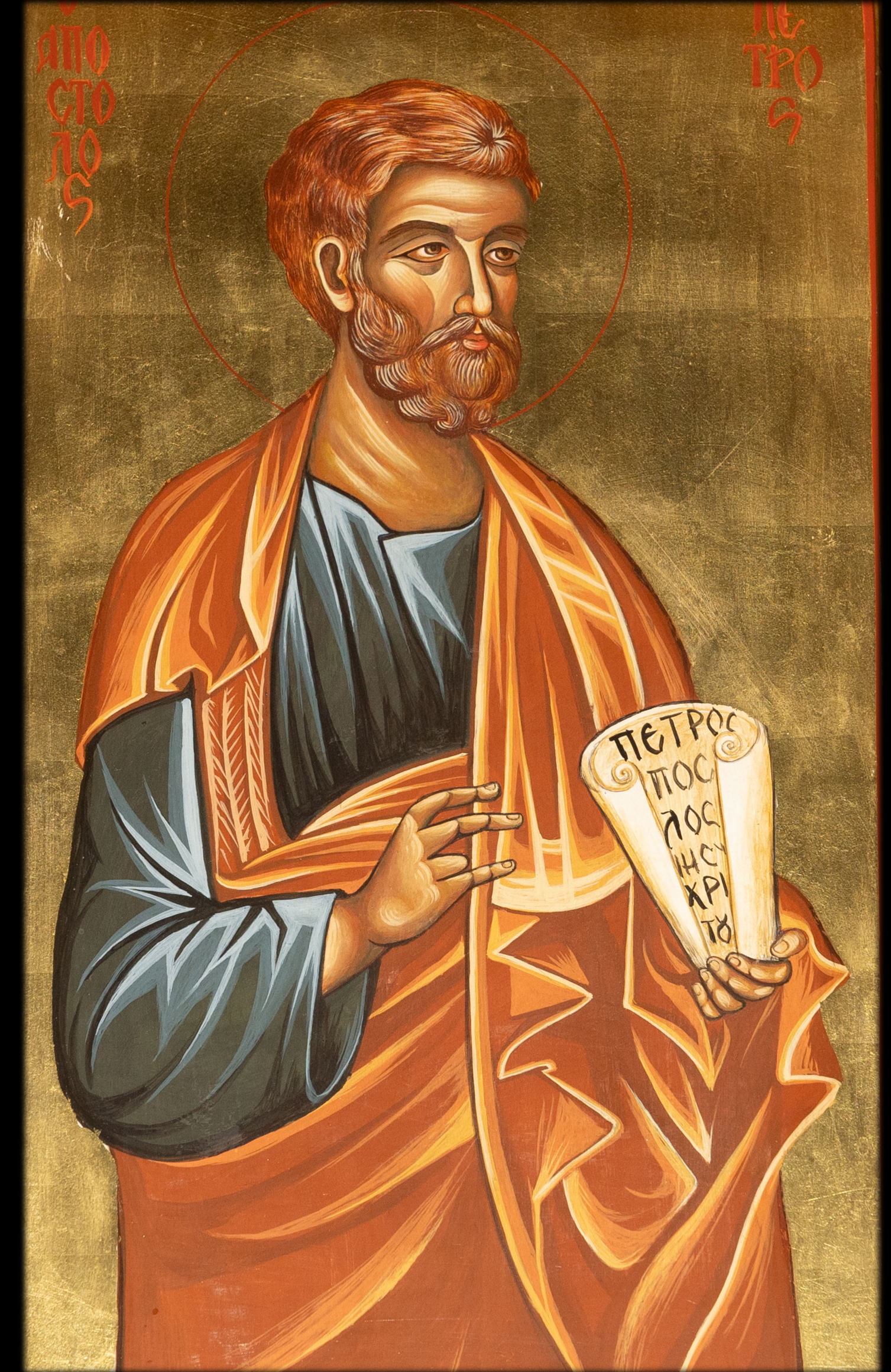
Εικόνα Ἀπ. Πέτρου, Γ. Ναὸς Ἁγίου Ἀνδρέα Ἁγῶ Πατησίων