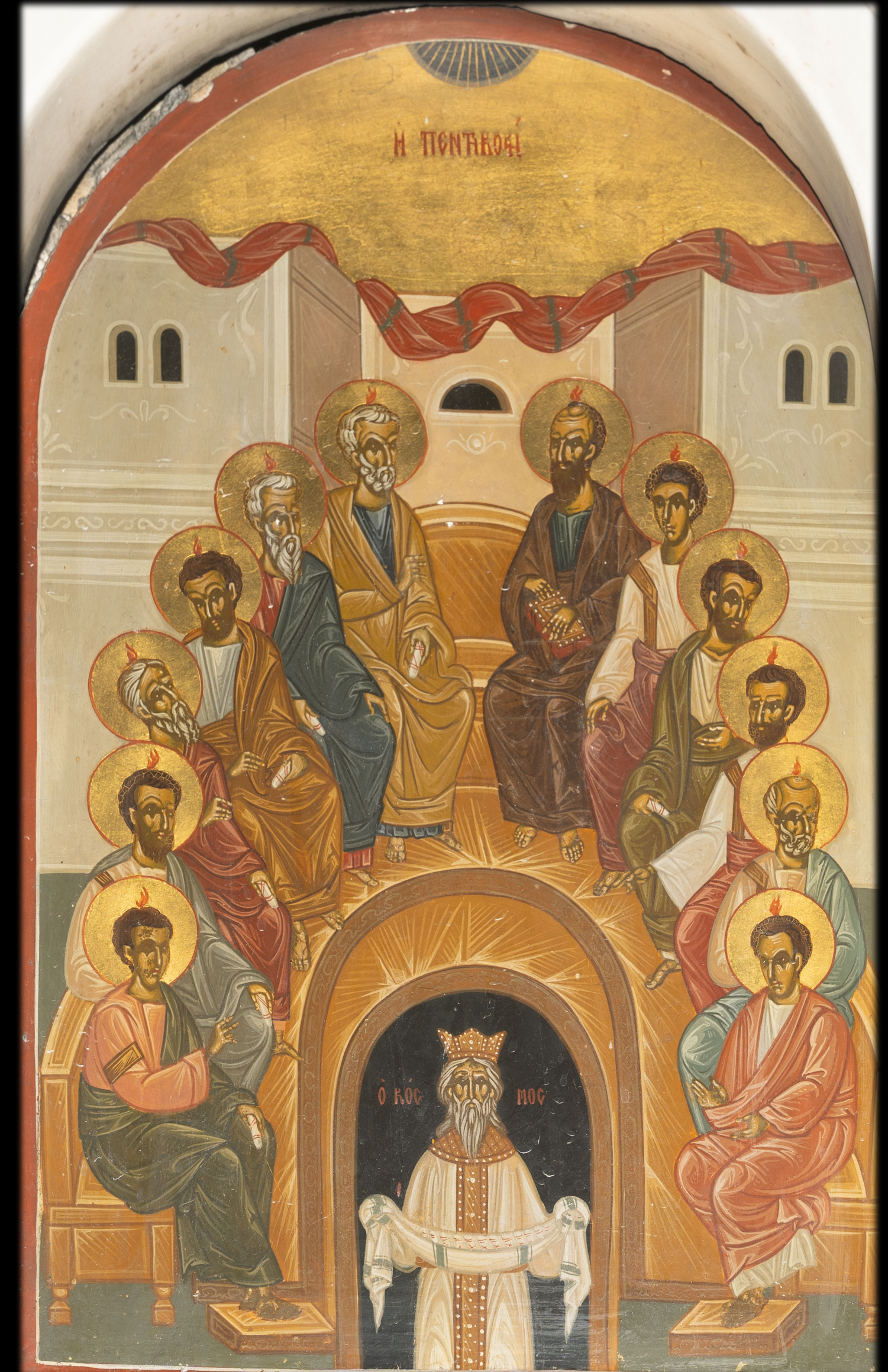
Εἰκόνα τῆς Πεντηκοστῆς, Ἱ. Ναὸς Μεταμορφώσεως Σοτήρος Καλλιθέας

ΚΑΙ ἐν τῷ συμπληροῦσθαι τὴν ἡμέραν τῆς πεντηκοστῆς ἦσαν ἅπαντες ὁμοθυμαδὸν ἐπὶ τὸ αὐτό. 2 καὶ ἐγένετο ἄφνω ἐκ τοῦ οὐρανοῦ ἦχος ὡσπερ φερομένης πνοῆς βιαίας, καὶ ἐπλήρωσεν ὅλον τὸν οἶκον οὗ ἦσαν καθήμενοι· 3 καὶ ὤφθησαν αὐτοῖς διαμεριζόμεναι γλῶσσαι ὡσεὶ πυρός, ἐκάδισέ τε ἐφ' ἓνα ἕκαστον αὐτῶν, 4 καὶ ἐπλήσθησαν ἅπαντες Πνεύματος Ἁγίου, καὶ ἤρξαντο λαλεῖν ἑτέραις γλώσσαις καθὼς τὸ Πνεῦμα ἐδίδου αὐτοῖς ἀποφθέγγεσθαι. 5 Ἦσαν δὲ ἐν Ἱερουσαλὴμ κατοικοῦντες Ἰουδαῖοι, ἄνδρες εὐλαβεῖς ἀπὸ παντὸς ἔθνους τῶν ὑπὸ τὸν οὐρανόν· 6 γενομένης δὲ τῆς φωνῆς ταύτης συνῆλθε τὸ πλῆθος καὶ συνεχύθη, ὅτι ἤκουον εἰς ἕκαστος τῇ ἰδίᾳ διαλέκτῳ λαλούντων αὐτῶν. 7 ἐξίσταντο δὲ πάντες καὶ ἐθαύμαζον λέγοντες πρὸς ἀλλήλους· οὐκ ἰδοὺ πάντες οὗτοί εἰσιν οἱ λαλοῦντες Γαλιλαῖοι; 8 καὶ πῶς ἡμεῖς ἀκούομεν ἕκαστος τῇ ἰδίᾳ διαλέκτῳ ἡμῶν ἐν ἣ ἐγεννήθημεν, 9 Πάρθοι καὶ Μῆδοι καὶ Ἑλαμίται, καὶ οἱ κατοικοῦντες τὴν Μεσοποταμίαν, Ἰουδαίαν τε καὶ Καππαδοκίαν, Πόντον καὶ τὴν Ἀσίαν, 10 Φρυγίαν τε καὶ Παμφυλίαν, Αἴγυπτον καὶ τὰ μέρη τῆς Λιβύης τῆς κατὰ Κυρήνην, καὶ οἱ ἐπιδημοῦντες Ῥωμαῖοι, Ἰουδαῖοί τε καὶ προσήλυτοι, 11 Κρήτες καὶ Ἄραβες, ἀκούομεν λαλούντων αὐτῶν ταῖς ἡμετέραις γλώσσαις τὰ μεγαλεῖα τοῦ Θεοῦ; 12 ἐξίσταντο δὲ πάντες καὶ διηπόρουν, ἄλλος πρὸς ἄλλον λέγοντες· τί ἂν θέλοι τοῦτο εἶναι; 13 ἕτεροι δὲ χλευάζοντες ἔλεγον ὅτι γλεύκους μεμεστωμένοι εἰσὶ. (Πραξ. 2,1-13)