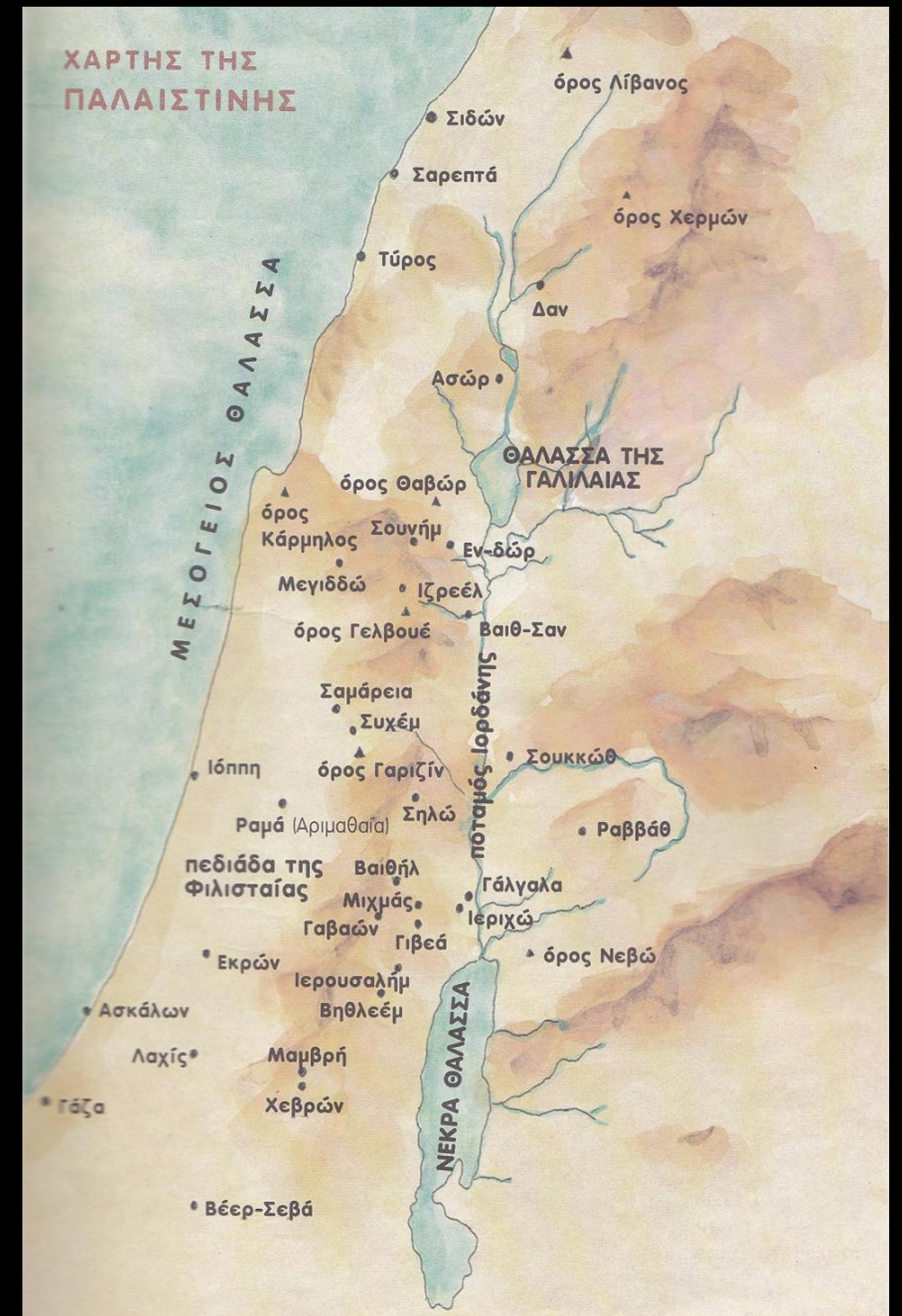
Η Παλαιστίνη την εποχή του Χριστού