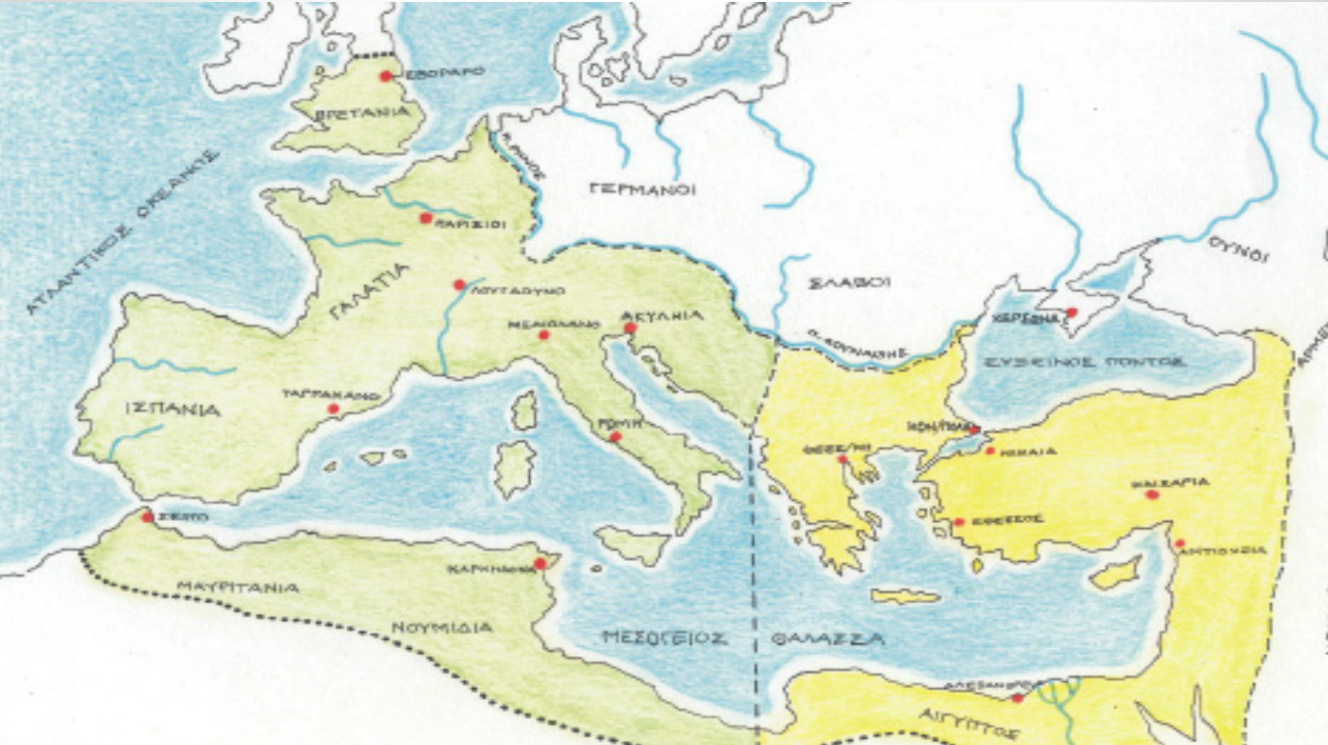
Ὁ Ρωμαϊκὸς κόσμος