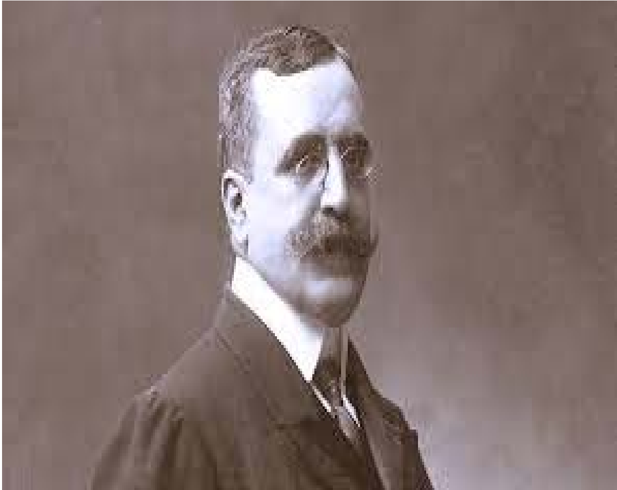
José Canalejas (1854-1912), πρωθυπουργός της Ισπανίας (1910-1912)