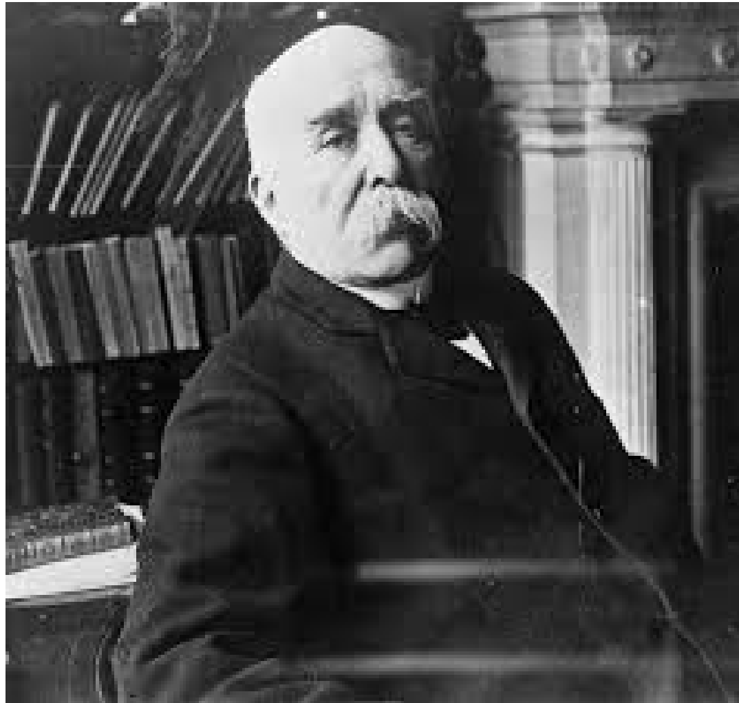
Georges Clemenceau (1841-1929), πρωθυπουργός της Γαλλίας (1906-1909, 1917-20)