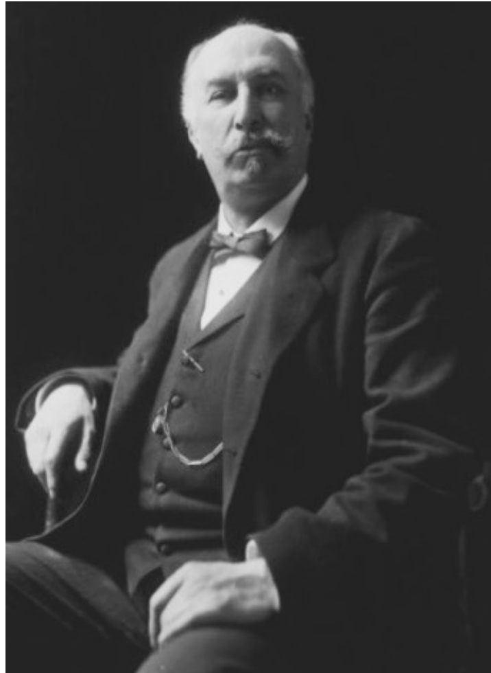
Giovanni Giolitti (1842-1928), πρωθυπουργός της Ιταλίας (1903-1914)