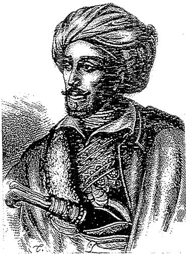
Α. Τάσσο, Μακρυγιάννης , 1943, ξυλογραφία σε όρθιο ξύλο, 33 x 24,5 εκ.