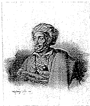
Karl Krazeisen Franz Hanfstaengl Josef Anton Selb. Μακρυγιάννης , 1828, λιθογραφία με κραγιόνι και πενάκι, 51,5 x 39,5 εκ.

φή του Στάλιν προοριζόταν για μία από τις δύο αυτές εκδόσεις; Υφολογικά άλλωστε η προσωπογραφία του Στάλιν προσεγγίζει πολύ την προσωπογραφία του Μακρυγιάννη, έργο του 1943 15 , με ακριβές πρότυπο το εκ του φυσικού σχέδιο του στρατηγού από τον βαυαρό εθελοντή υπολοχαγό Karl Krazeisen (1794-1878) που έγινε στην Αίγινα, στις 7 Ιανουαρίου 1827, το λιθογράφησε με κραγιόνι και πενάκι 16 στο Μόναχο το 1828 ο Franz Seraph Hanfstaengl (1804-1877) 17 και το τύπωσε ο Josef Anton Selb (1784-1832) για να εκδοθεί σε λεύκωμα 18 . Και στα δύο έργα η λεπτομερής χάραξη δεσπόζει. Ακόμα η υπογραφή του καλλιτέχνη, με το πρώτο γράμμα του Τάσσο, το Τ., είναι και στις δύο ξυλογραφίες όμοια και χαραγμένη στο αυτό σημείο.