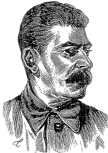
Α. Τάσσο, Στάλιν , π. 1943-45, ξυλογραφία σε όρθιο ξύλο, 18,7 x 13,5 εκ.