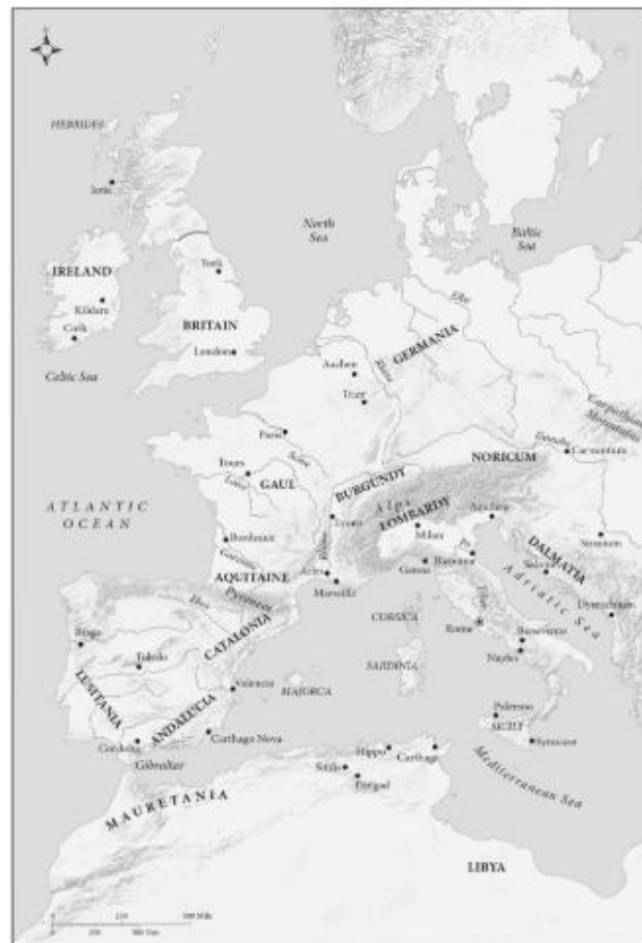
Map 3. Late Antique Western Europe.