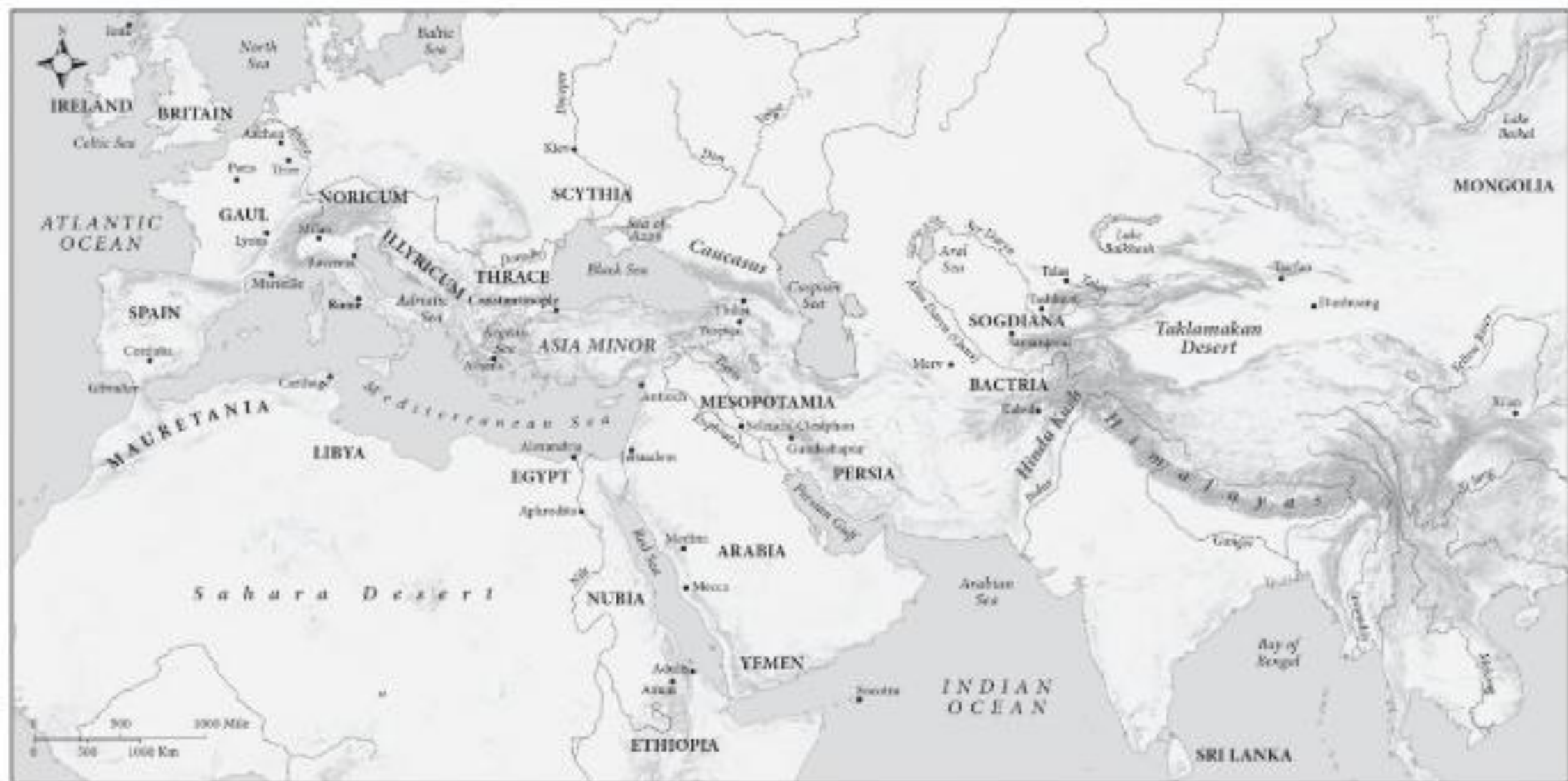
Map 1. Late Antique Eurasia.