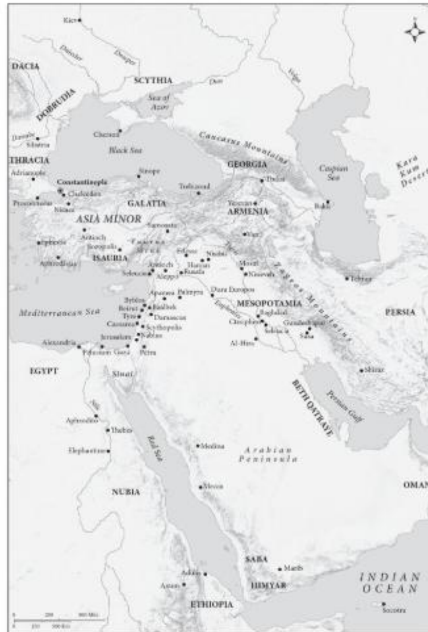
Map 4. Late Antique Near East.