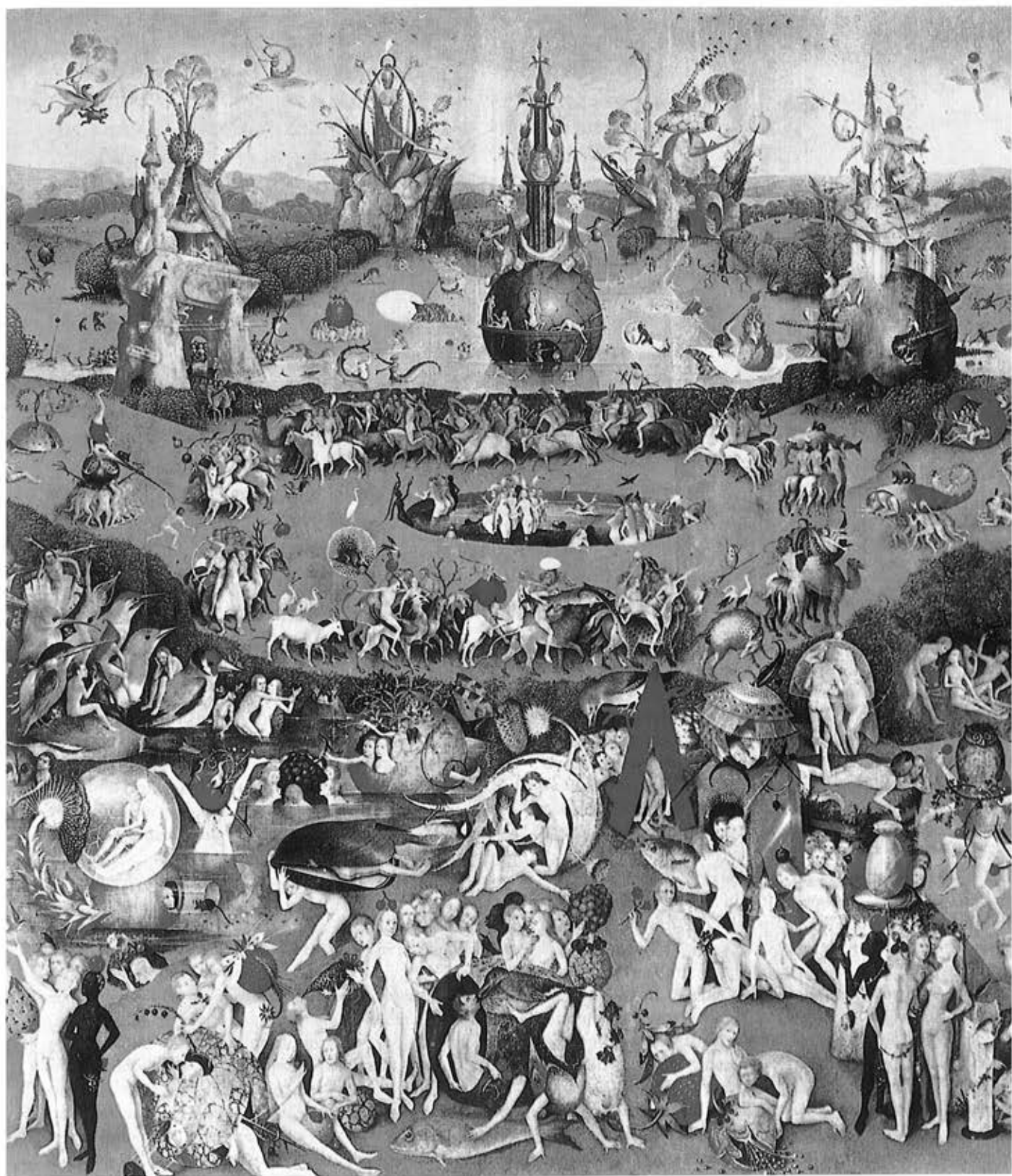
Ιερώνυμος Μπος, Ο Κήνος των Τέρψεων (220 x 195 cm)